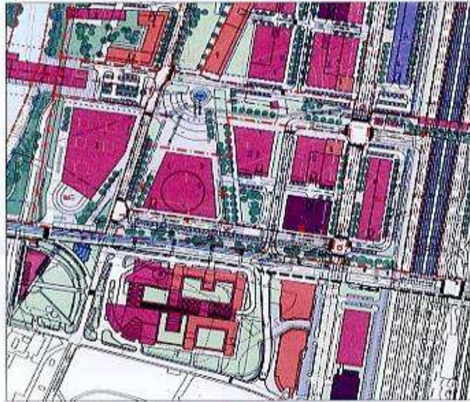
PODKLAD PRE NÁVRH ZMIEN (MARKROP s.r.o. 03.2009)