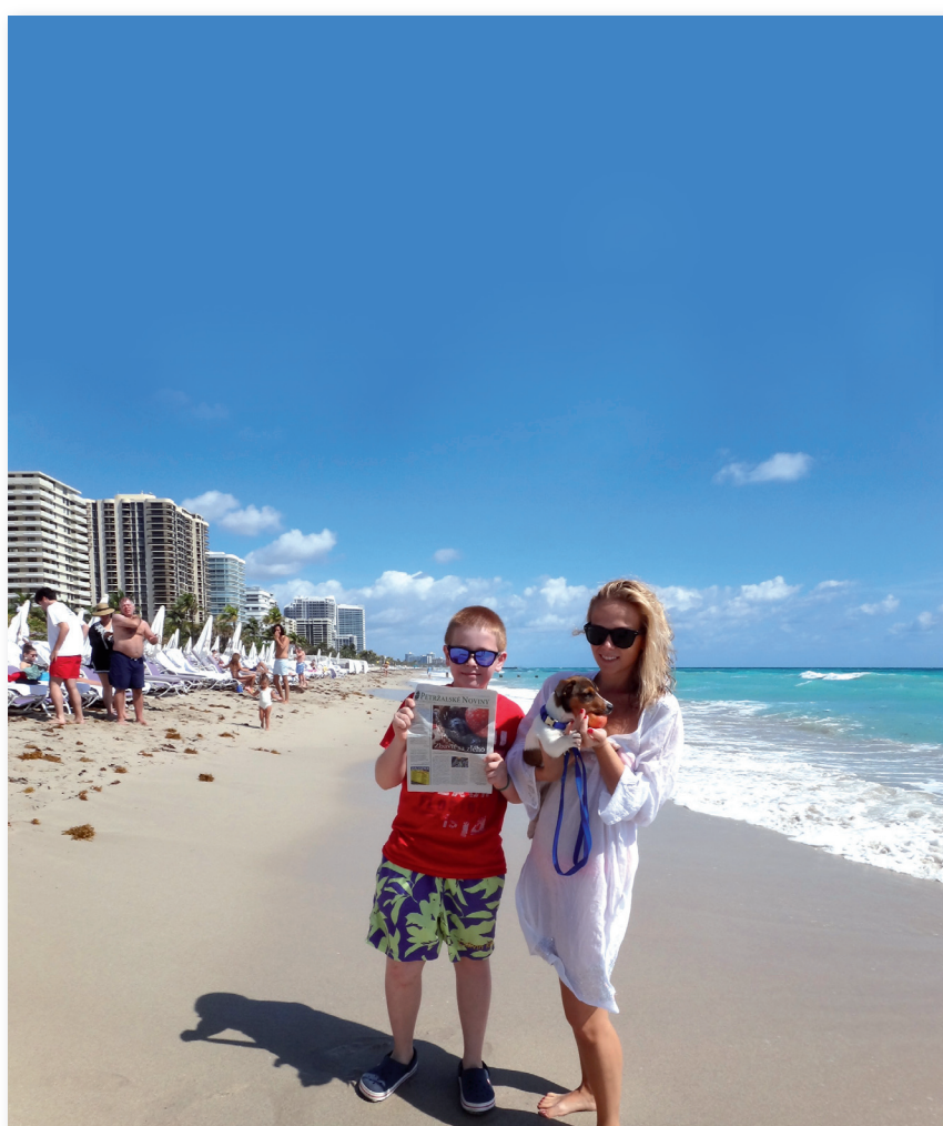
Na prázdninách v Miami.