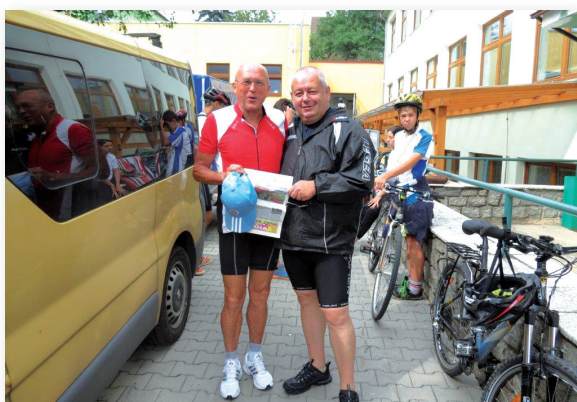
Z cyklotúry do Prahy ešte jedna spoločná fotografia pre Petržalské noviny