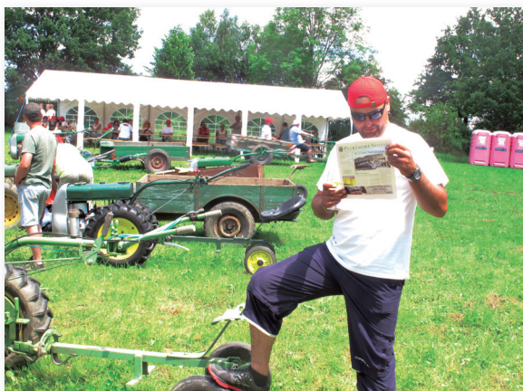
Oddych počas splavu, Česko.