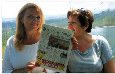
V lanovke na Chopok.

Petržalčania si pribalili do cestovných tašiek a kufrov, že založia medzi osobné a intímne veci akurát vaše-naše noviny. Že ony budú svojráznym cestovným pasom, originálnym dokladom miestno-mestskej totožnosti - kto sú a odkiaľ prichádzajú. Tak ako si ich