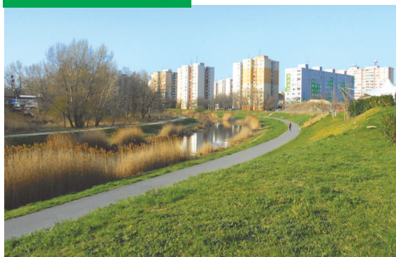
Petržalka City, Chorvátske rameno a budúci Central park