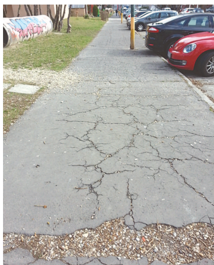
Chodník na Medvedovej 30-32