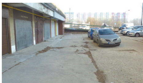
Parkovisko na Tupolevovej 1-3