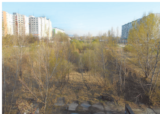
Budúcnosť (2020?): konečná, posledná, desiatá zastávka elektricky v Petržalke - Janíkov dvor

Začínate akoby od nuly, hoci nejde o „nulové“ územie. Nie je to územie ničoho, nikoho.