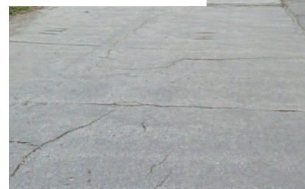
Chodník pri ZŠ na Pankúchovej

Nechodia vám Petržalské noviny? Kontaktujte nás: tel: 0905 273 417 mail: mrk@mrk-agency.sk