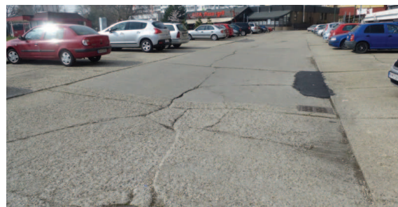
Parkovisko na Fedinovej 2-6