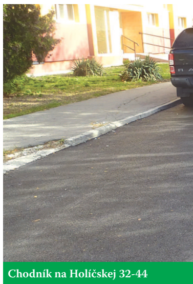
Chodník na Holíčskej 32-44