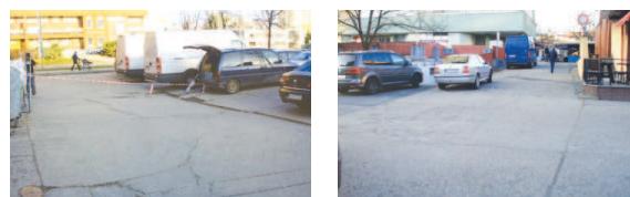
Parkovisko na Mlynarovičovej