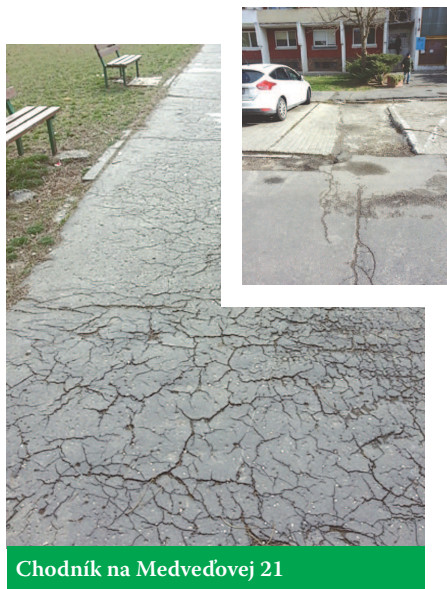
Chodník na Medvedovej 21

Petržalka sa už tento rok pustila do veľkej rekonštrukcie chodníkov a parkovísk. Poslanci na tieto akcie v rozpočte vyčlenili 400-tisíc eur. Pozrite sa, na čo sa konkrétne použijú.