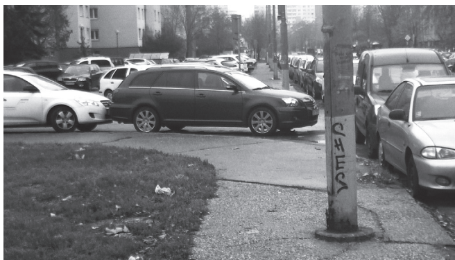
Otázka pre vodiča za 50 eur – kadiaľ prejde matka s kočíkom?