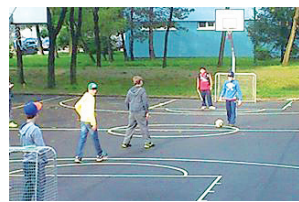
Chalani na Bradáčovej.

aj jeden obyvateľ môže byť pre Petržalku dôležitý. Pani in invalidnom vozíku, ktorá sa už niekoľko rokov stará o čistotu parkoviska pri svojom dome, či všetci tí, ktorí sa starajú o rozkvitnuté predzáhradky, upravené vnútrobloky, parčíky a ihriská. „Vždy ma poteší,