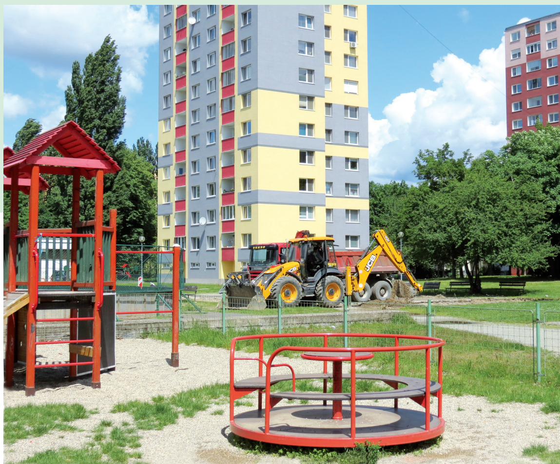
Práve teraz opravujú aj športovisko na Medvedovej

lia odhlasovali oddychovú zónu na Jasovskej ulici 17. Verejné športové ihrisko s rozlohou 625 m 2 , ktoré bolo bez športových prvkov a iných zariadení, doplnila mestská časť o basketbalové konštrukcie, malé bránky vhodné na futbal aj hokejbal, o zariadenie na volejbal, nohejbal a tenis a nechýbalo ani zariadenie herných plôch pre spomínané športy.