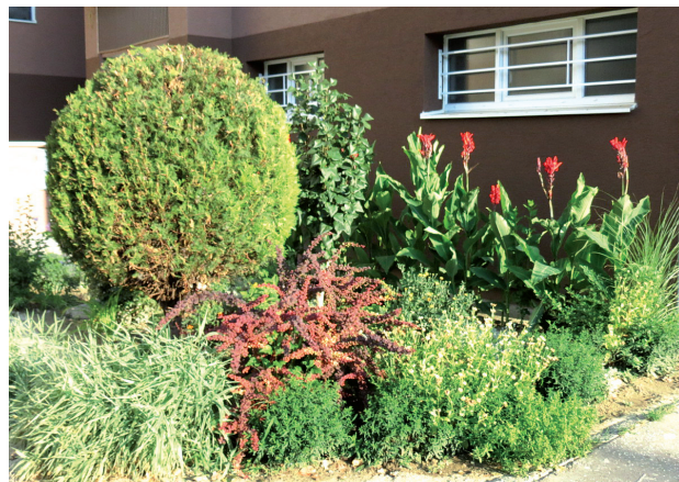
Rozkvitnutá predzáhradka pred vchodom do obytného bloku