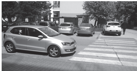
V meste je takýchto dopravných prehrškov na stovky, policajti stále nič nevidia

V Bratislavskom kraji za prvé tri mesiace roka 2014 zaznamenali policajné štatistiky 12 prípadov trestného činu Týranie blízkej osoby a zverenej osoby (SR 88), na základe ktorých bolo vyšetrovaných sedem osôb (objasnenosť 42 %). Tak vraví, okrem iného, paragraf 208 trestného zákona v súvislosti s týraním blízkej osoby a zverenej osoby: Kto týra blízku osobu alebo osobu, ktorá je v jeho starostlivosti alebo výchove, spôsobujú jej fyzické utrpenie alebo psychické utrpenie bitím, kopaním, údermi, spôsobením rán a popálením rôzneho druhu, vyhrážaním, vyvolávaním strachu alebo stresu, násilnou izoláciou, bezdôvodným odopieraním stravy, oddychu alebo spánku alebo odopieraním nevyhnutnej osobnej starostlivosti, ošatenia, hygieny, zdravotnej starostlivosti, potrestá sa odňatím slobody na tri roky až osem rokov. (Okolnosťou podmieňujúcou použitie vyššej trestnej sadzby – na sedem rokov až dvadsaťpäť rokov alebo trestom odňatia slobody na doživotie - je závažnejší spôsob konania, osobitný motív, ťažká ujma na zdraví viacerým osobám alebo smrť viacerých osôb a.i.).