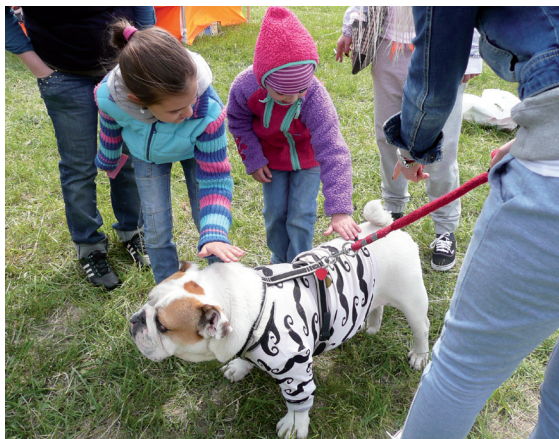
Najvďačnejšími účastníkmi akcie sú každý rok deti.

Milujete svojho nečistokrvného psíka? Považujete ho za najrozkošnejšiu zvieraciu bytosť na svete? Neváhajte a ukážte ho aj ostatným! Bratislavčania sa totiž so svojimi štvornohými miláčikmi budú už po deviatykrát uchádzať o titul Pes sympaták. Petržalčania pritom nikdy nechýbali a veríme, že to tak bude aj teraz. Súťaž, v ktorej budú diváci v úlohe porotcov hodnotiť príbeh, ihravosť, poslušnosť, ale najmä vzťah psa a jeho „pána“ bez ohľadu na vek a rasu, sa uskutoční v sobotu 31. mája 2014 od 10. h v športovom areáli na Černočského ulici v Rači-Krasňanoch.