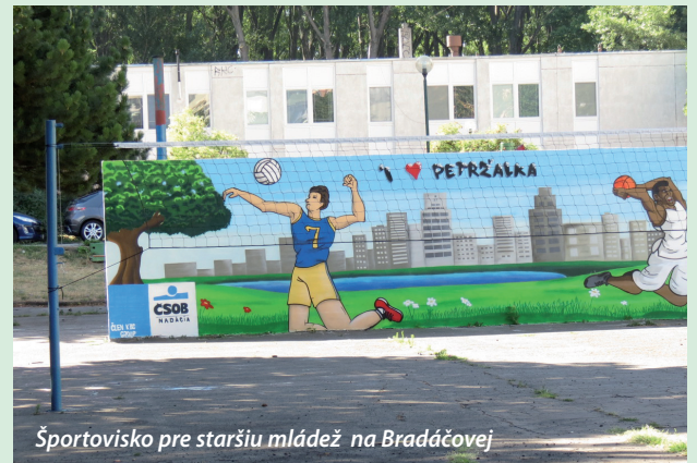
Športovisko pre staršiu mládež na Bradáčovej

Podľa posledného sčítania tvoria deti do pätnásť rokov desatinu obyvateľov Petržalky. Na základe demografického vývoja je zrejmé, že ich počet bude aj nasledujúce roky rásť. Potrebujú nielen miesta v škôlkach, ale aj miesta na aktivity vonku. Petržalka preto každoročne investuje nemalú časť prostriedkov práve na revitalizáciu ihrísk a športovísk.