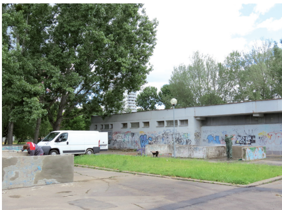
ihrisko na Hrobákovej si vyberali Petržalčania hlasovaním na webovej stránke mestskej časti, ktoré sa uskutočnilo vo februári