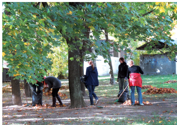
Dobrovoľníckou akciou zamestnancov firma Swiss Re v minulom roku vyčistila a zveladila parčík na Hrobákovej ulici.