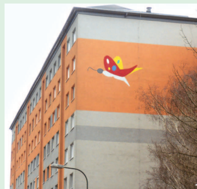
Turnianska 4 (voľnosť, zvedavosť, hravosť)