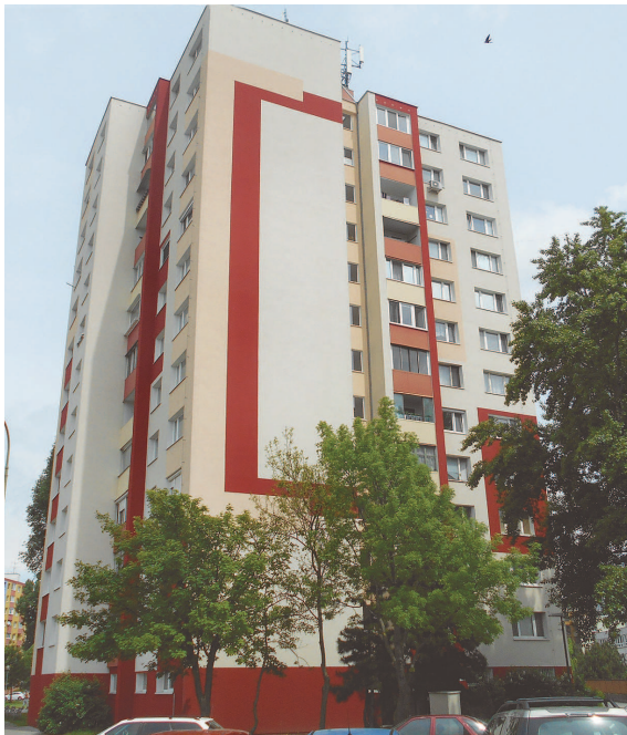
Andrusovova 7 (ambicióznosť, cieľavedomosť, odvážnosť)