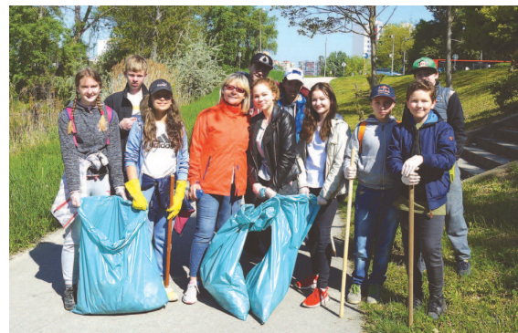
Žiaci 7.A zo ZŠ Tupolevova

Wifi router, spodná bielizeň, fľaše od alkoholu, vrecúška so psími exkrementmi a najmä plastový odpad. To boli „úlovky“ dobrovoľníkov, ktorí sa druhý májový štvrtok zapojili do čistenia Chorvátskeho ramena. Miestny úrad zabezpečil pracovné pomôcky a jeho pracovníci sa pridali k dobrovoľníkom.