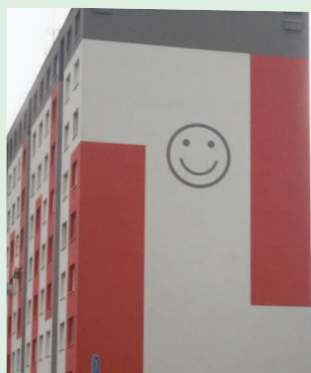
Lubovnianska 10 (veselosť, optimizmus, šibalstvo)