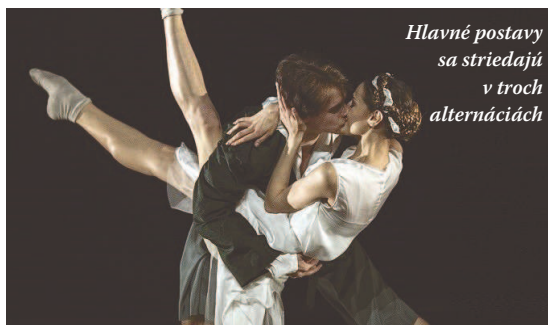
Hlavné postavy sa striedajú v troch alternáciách