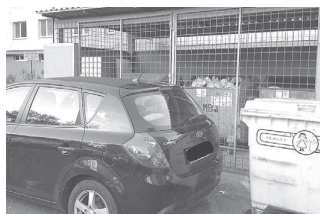
Aj hlúpy schybi foto: (čitateľ/PN)

Bratislavskí dopravní policajti apelujú na vodičov, aby jazdili bezpečne, plne sa venovali vedeniu vozidla, rýchlosť jazdy za každých okolností prispôbili svojim schopnostiam a vlastnostiam motorových vozidiel. Zodpovedným prístupom a dôsledným dodržiavaním pravidiel cestnej premávky vodiči predídú neželaným a tragickým následkom na cestách.