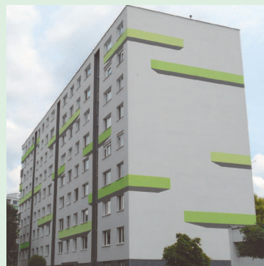
Belinského 9-11 (vzájomnosť, nezávislosť, dôvera)