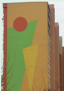
Tupolevova 1 (harmónia, túžba, nádej)