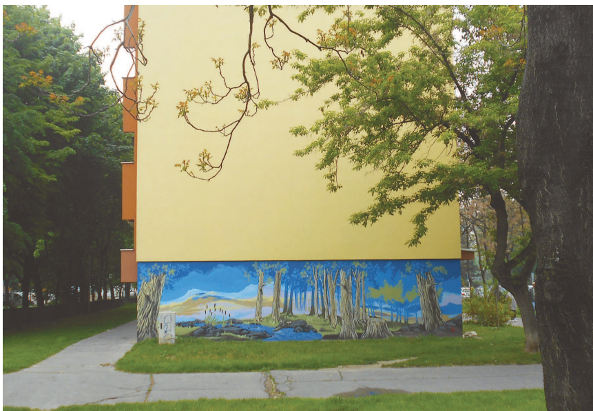
Polereckého 9 (návrát k pôvodnému, návrat k prírode)