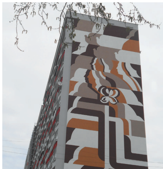
Osuského 1 (pôvodná monumentálna maľba Mier z r. 1985, obnovená v r. 2015 - kontinuita, solidárnosť, budúcnosť)

Domy, aj keď sa zdá, že mlčia, lebo sú to len nemé pospájané panely, ľahko pomýlia. Ony však majú svoju reč. Privrávajú sa okoliu. Vyjadrujú, dávajú sa najavo. Predstavujú sa... Potom to, čo sa javí navonok - symbolom, kresbou, malbou, výtvarnou kompozíciou, grafickým prvkom - je v skutočnosti ich vnútorným obsahom. Je možná úvaha, že je to nevysslovená reč panelákového osadenstva na voľnej, prázdnej, veľkoplšnej zateplenej štítovej stene domu? Jeho nálady, atmosféra, vzťahy, predstavy, spôsoby? Keby to tak nebolo, asi by to tam, a také, nebolo... (Čo znamená