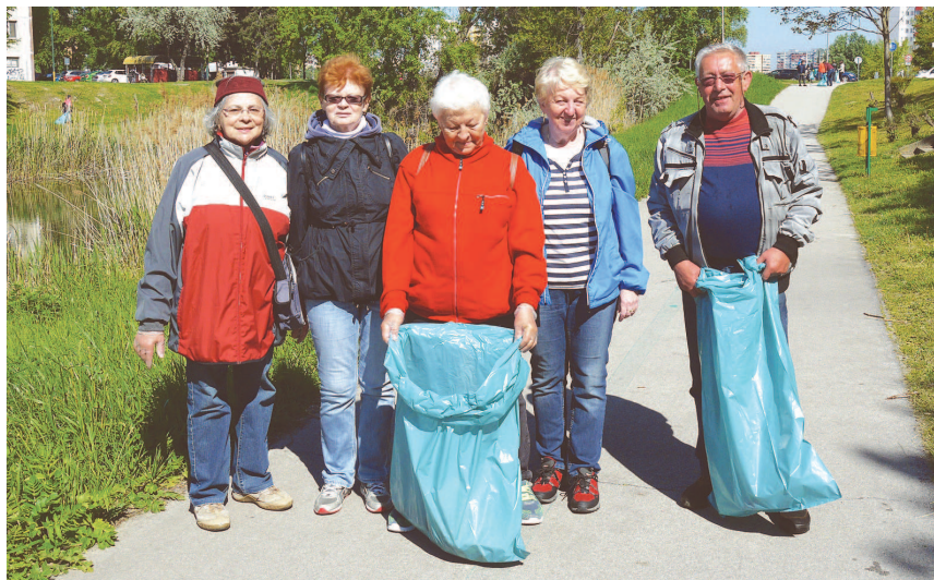
Kolektív z Denného centra na Strečnianskej

služieb 660 kg vyzbieraného odpadu. Všetkým viac ako 150 žiakom, študentom, seniorom, zamestnancom úradu, Petr- žalčanom aj obyvateľom iných mestských častí, ktorí sa na čistení zúčastnili, preto patrí veľké ĎAKUJEME.