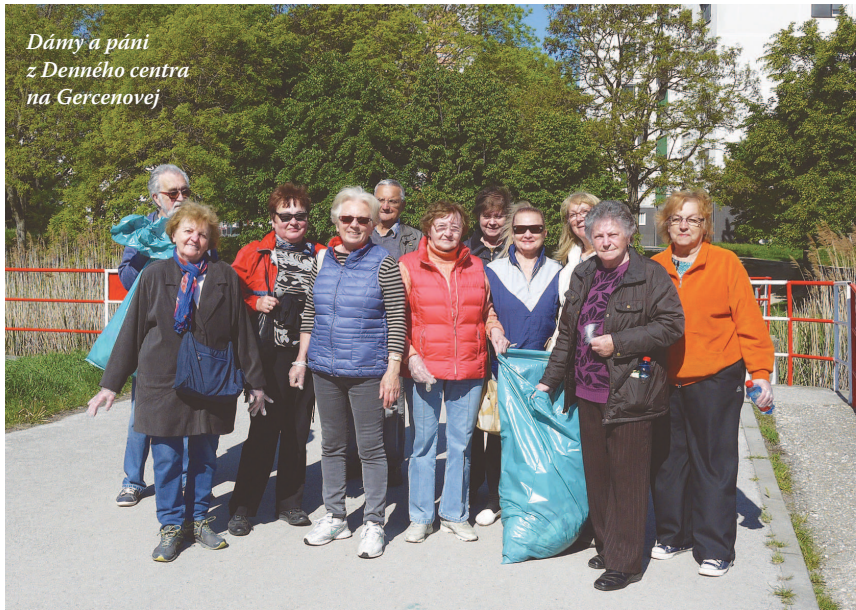
Dámy a páni z Denného centra na Gercenovej