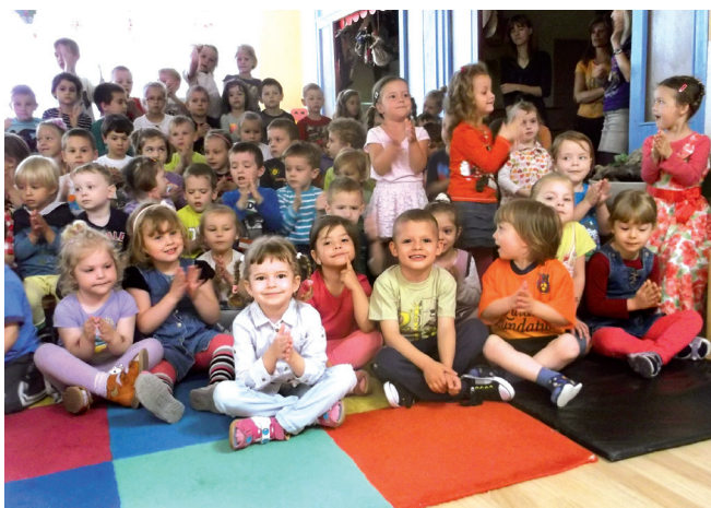
Stražanovo bábkové divadlo zahralo rozprávku o Gašparkovi a Jankovi v pekle, ktoré deti sledovali so zatajeným dychom