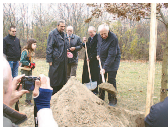
Ladislav Chudík pri sadení dubu v roku 2009

Na Starhadskej ulici žil človek, ktorého poznalo a vážilo si celé Slovensko. Predposlednú júnovú stredu sme si pripomenuli pamiatku Ladislava Chudíka. A to takmer doslova pod jeho oknami. Na mieste, ktoré by zmizlo pod betónom parkoviska, nebyť neúnavnej snahy Občianskeho združenia Za zeleň Petržalky. Dnes však už lúku nechráni len OZ, ale aj sedem slovenských osobností - Eva Sirkáková, Milka Vašáryová, Daniel Hevier, Marika Gombitová, Milan Lásica a už z druhej strany Anton Srholec a Ladislav Chudík.