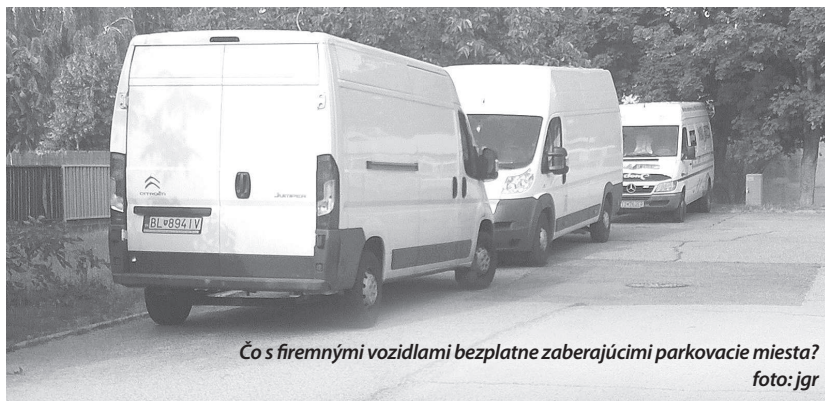
Čo s firemnými vozidlami bezplatne zaberajúci parkovacie miesta?

... v čase od 15. do 26. 6. nahlásili v našom kraji krádež 10 motorových vozidiel, z toho v Petržalke štyri (Einsteinova, Smaragdová 2, Polereckého)? V noci zmizlo 7 a cez deň 3 autá. Ukradli aj jeden motocykel. V dňoch 15., 16., 19. a 23. krádež auta nehlásili.