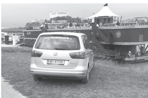
U nás, v Rakúsku, sa po trávnikoch jazdiť nesmie, takže to využívam v Bratislave.

V bratislavskom kraji za prvých sedem mesiacov tohto roka zaznamenali policajné štatistiky deväť prípadov trestného činu šírenie poplašnej správy (SR 43), na základe ktorých boli trestne stíhané, resp. vyšetované tri osoby (objasnenosť 33 %). Tak, okrem iného, vraví § 361 zákona č. 300/2005 Z.z. Trestný zákon v súvislosti so šírením poplašnej správy: Kto úmyselne spôsobí nebezpečenstvo vážneho znepokojenia aspoň časti obyvateľstva nejakého miesta tým, že rozširuje poplašnú správu, ktorá je nepravdivá, alebo sa dopustí iného obdobného konania spôsobilého vyvolať také nebezpečenstvo, potrestá sa odňatím slobody až na dva roky. (Okolnosťou podmieňujúcou použitie vyššie trestnej sadzby - odňatie slobody až na osem rokov – je predchádzajúce odsúdenie páchatela za taký čin a/alebo ak ním spôsobí vážnu poruchu v hospodárskej prevádzke alebo hospodárskej činnosti právnickej osobe alebo v činnosti štátneho orgánu alebo iný obzvlášť závažný následok).