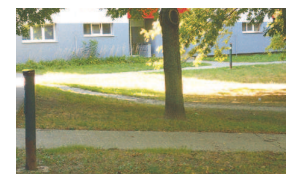
Lúky III, Lietavská 12 až 16 zo zadu bytových domov, vnútroblok Lietavská Budatínska Znievska