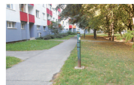
Lúky III, Lietavská 8, zo zadu bytového domu, vnútroblok Lietavská - Znievska - Budatínska

lave námietky, ako aj podnet. Tender na nového prevádzkovateľa verejného osvetlenia v hlavnom meste kritizujú niektorí mestskí poslanci a