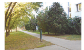
Lúky III, Lietavská 14-16 zo zadu bytového domu, vnútroblok Lietavská - Znievska - Budatínska