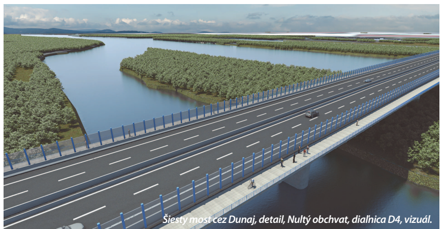
Šiesty most cez Dunaj, detail, Nultý obchvat, diaľnica D4, vizuál.