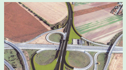
Vizuál budúcej križovatky Jarovce, diaľnica D4 Nultý obchvat a diaľnica D2 na Budapešť.