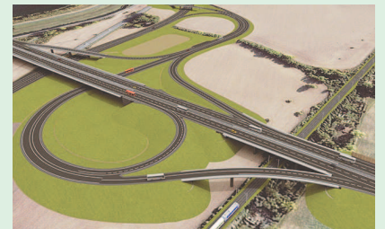
Vizuál budúcej križovatky Rusovce Nultý obchvat, diaľnica D4.