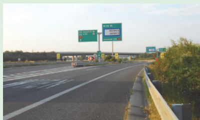
Súčasná križovatka pred Jarovcami, diaľnica D2 na Budapešť.