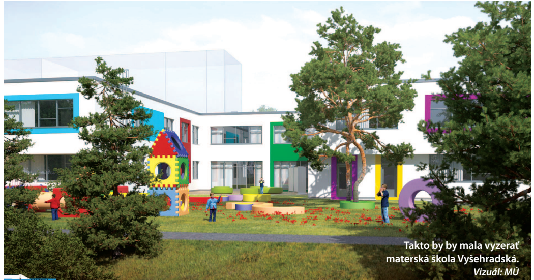
Takto by mala vyzerat materská škola Vyšehradská. Vizuál: MÚ