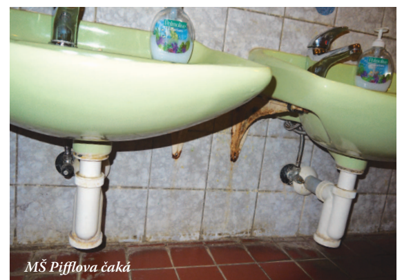
MŠ Pífflova čaká