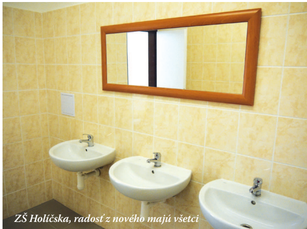
ZŠ Holíčska, radosť z nového majú všetci