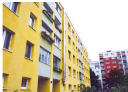
Bytový dom na Haanovej ulici. Lacnejšie a kvalitnejšie s vlastnou kotolňou

Starostov mestských častí k tomuto postupu zaväzuje uznesenie Mestského zastupiteľstva hlavného mesta SR Bratislavy č. 231/2015 z 25. júna 2015, ktoré rieši doterajší nejednotný postup starostov pri vydávaní záväzného stanoviska obce o súlade navrhovanej výstavby s koncepciou mesta v oblasti tepelnej energetiky. Mestské časti totiž v zmysle zákona nemajú vlastnú koncepciu v tejto oblasti a pri vydávaní záväzných stanovísk musia vychádzať z koncepcie, ktorú mesto prijalo ešte v roku 2008 samostatným uznesením č. 496.