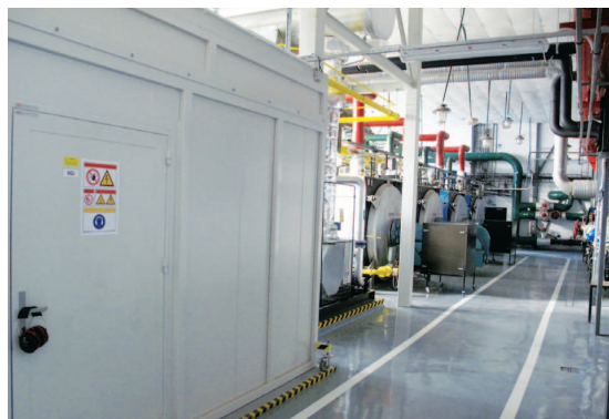
CZT - modernizovaná kotelňa s vysoko účinnou kombinovanou výrobou elektriny a tepla

Tepelné rozvody sú inžinierske siete tak ako vodovody, kanalizácia, elektrické a plynové siete a telekomunikačné