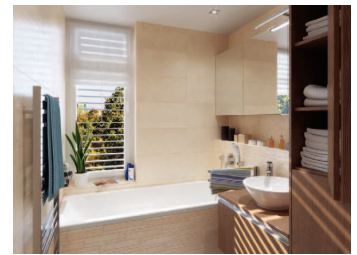
Kúpeľňa s oknom je niečo, čo poznáme väčšinou iba v rodinných domoch.