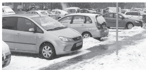
Sneh, námrazy, zimná čľapkanica – perspektíva prichádzajúcich dní.

... v čase od 8. do 19.10. nahlásili v našom kraji krádež 30 motorových vozidiel, z toho v Petržalke 8 (Belinského, Panónska, Krasovského, Bulíkova, Mánesovo nám., Ševčenkova, Lachova, Švabinského)? V noci zloději potiahli 24 a cez deň 6 vozidiel. Zmizli aj dva motocykle. V dňoch 27. a 29. septembra krádež vozidla nehlásili.