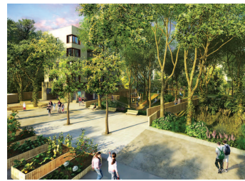
V prírodnej časti parku sa nachádza veľké detské ihrisko.