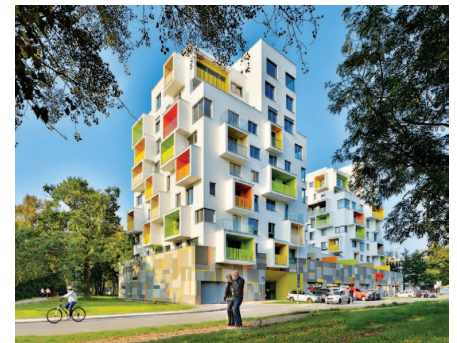
Projekt Nový háj na Starohájskej ulici, ktorý získal Cenu za architektúru CE.ZA.AR. 2015