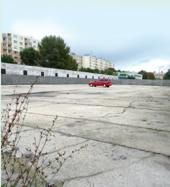
Parkovisko na Macharovej je stále opustené. Problémom je jeho osvetlenie.