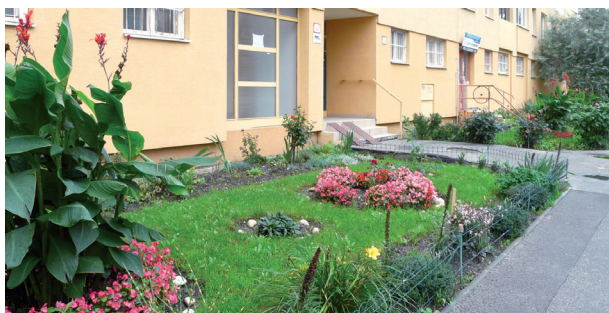
Bezmála v každom paneláku sa nájde zopár ľudí, ktorí sú do udržiavania priestoru pred domom ochotní investovať vlastné peniaze a čas. Už druhú sezónu sa o ten svoj starajú obyvatelia Wolkrovej 31.

Len málokto vie, že ju na svetlo sveta vyniesol pred necelým desaťročím staromestský poslanec vlastniaci vilu a záhradu v oblasti Palisád. Znepáčilo sa mu upratovanie pred vlastným prahom v duchu onoho známeho „môj dom, môj hrad“. Podľa súčasného tzv. cestného zákona je totiž jeho povinnosťou v zime odhraňať z chodníka sneh, prípadne zlikvidovať zľadovatenu vrstvu tak, aby sa po ňom dalo bezpečne chodiť. No a keďže dĺžka plota ohraničujúca pozemok tohto pána je dlhšia ako napr. dĺžka chodníka pred jedným petržalským panelákom, vyrukoval so svojím názorom: Chodník patrí mestu, nech sa oň preto stará ono (prípadne mestská časť Staré Mesto)! Návrh predniesol na pôde staromestského parlamentu, ktorého bol v tom čase členom. Zakrátko sa k nemu prihlásili ďalší rovnako zmýšľajúci. V súčasnosti je už v slovenskom zákonodarnom zbore, kde sa k nemu majú vyjadriť poslanci zastupujúci obyvateľov celého Slovenska.