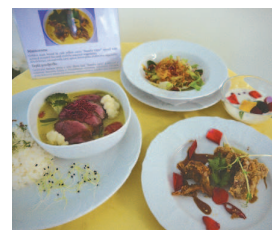
Michaela Dobříková foto: autorka