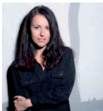
KATARÍNA KNECHTOVÁ akustický koncert