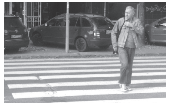
Slovenská ľudová: Chodníčky zarúbané autička na nich stoja, žandári zmlandrevli, a tak ich nedostali ... júuch!

24. 9. 2013 nahlásili v našom kraji krádež 62 motorových vozidiel, z toho v Petržalke jedenásť (Bzovicka, Ševčenkova, Panónska, Furdekova, Jasovská, Bosáková, Osuského, Blagoevova, Tupolevova, Černyševského, Einsteino-va)? V noci zlodeji uchmatli 50 a cez deň 7 áut. Päť bielych ťahačov Scania ukradli v nezistenom čase.