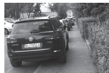
Cól sem - cól tam, do 150 cm aj tak parádne chýba.

Stávkovú kanceláriu na Nobelovom námestí navštívil nateraz neznámy muž, ktorý si pod hrozbou zbrane vzal 900 eur. Svoj lup si muž strednej postavy v čiernej mikine s kapucňou vložil do čiernej igelitovej tašky a ušiel.