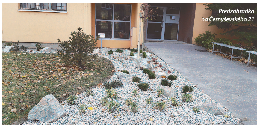
Predzáhradka na Černyševského 21

Michaela Platznerová foto: archív redakcie