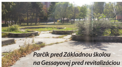
Parčík pred Základnou školou na Gessayovej pred revitalizáciou