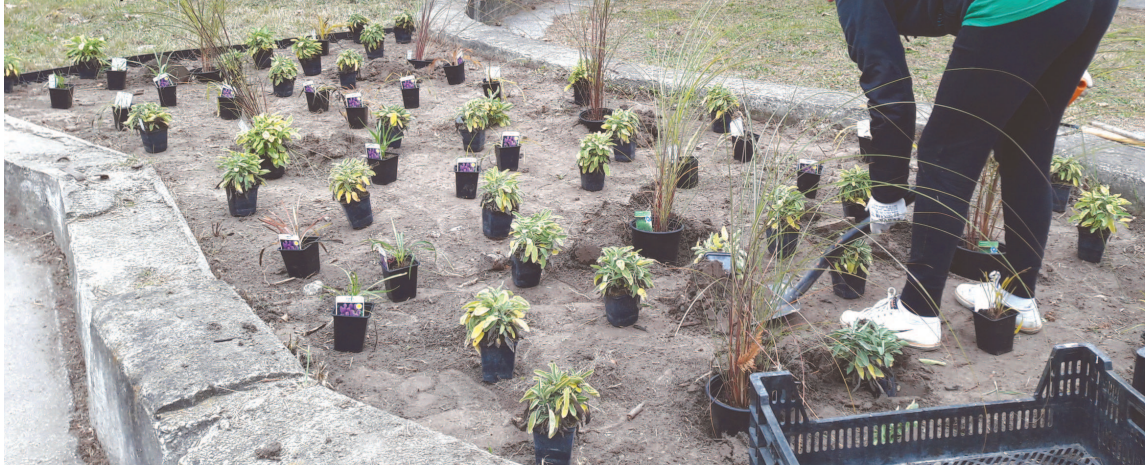
a počas realizácie revitalizácie