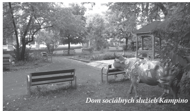
Dom sociálnych služieb Kampino