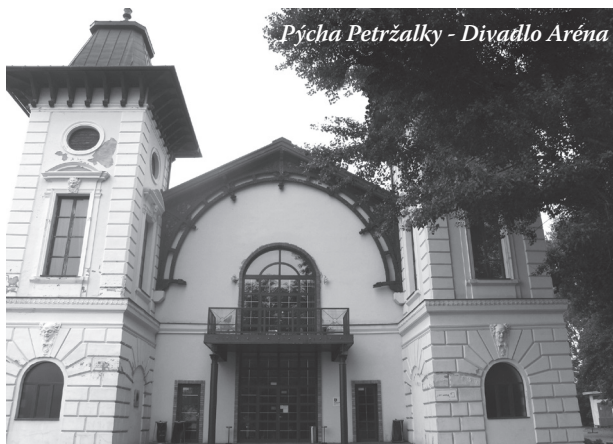
Pýcha Petržalky - Divadlo Aréna

Aha, 9. novembra sú voľby. Regionálne, do samosprávnych krajov. Šturmuje sa. Kandidáti s ich „kúskami“ reči nám nevyžadane padajú do poštových schránok, usmievajú sa na nás z bilbordov popri cestách, vtipkujú, kto má na čo nos; už vážnejšie - kto sa cíti architektom pozitívnej zmeny, alebo kto chce dať Bratislavskému kraju európsku úroveň, hoci by sme si v skromnosti vystačili s takou obyčajnou, normálnou úrovňou, napríklad, že si na zimných výtlkoch v lete nezničime autá; iný zasa nepotrebuje politikov ani politické strany, hoci predtým dvakrát úspešne použil ich koaličný výťah do iných zastupiteľstiev; ktosi nás chce liečiť, prečo aj nie, má to za profesionálnu povinnosť, napokon veď je aj kde, napr. krajská budova ako klinika prenajatá „privátnikom“ na ďalších 27 rokov. Na bilbordoch sú naši-vaši župan i poslanci, valí sa to ako prietrž, v ktorej tí neopatrnejší či skôr neznalejší sľubujú Petržalčanom v Petržalke lepšie cesty, aj keď kraj v nej nemá ani centimeter. Tak ako nemá ani škôlku. Hoci príslovie hovorí, že darovanému koňovi na zuby nepozerať, pár tisíc župných eur porozsypaných po mestách a dedinách sotva zvýši sľubované percentá umiestnených detí v škôlkach. Už vôbec nie v Petržalke. Ale bomba a úloha iným to je. Najmä, ak sa nechá explodovať pár týždňov pred voľbami. Keď sme pri