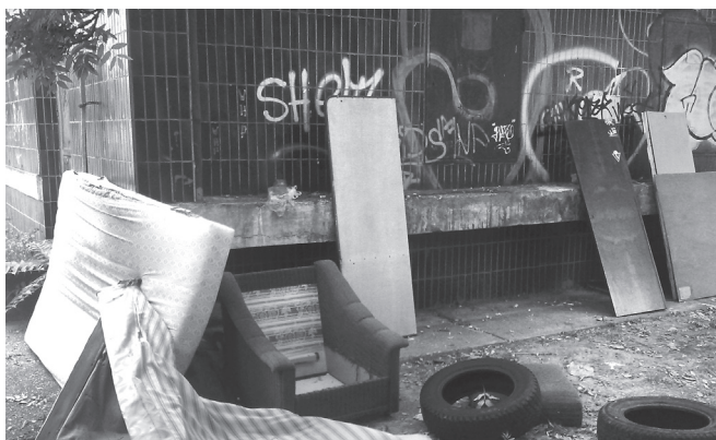
Za znečistenie verejného priestranstva možno uložiť pokutu do 33 eur. Kdeže však neporiadnici mesta, kto ich zlapá pri čine?

V Bratislavskom kraji za prvých osem mesiacov tohto roka zaznamenali policajné štatistiky 62 prípadov trestného činu krádeží do obchodov a skladov (SR 772), na základe ktorých bolo, aj s dodatočne objasnenými prípadmi, v tejto súvislosti trestne stíhaných, resp. vyšetrovaných 62 osôb, z toho dvaja mladiství (objasnenosť 15 %). Tak vraví § 212 Trestného zákona v súvislosti s krádežami: Kto si prisvojí cudziu vec tým, že sa jej zmocní a spôsobí tak malú škodu, potrestá sa odňatím slobody až na dva roky. (Okolnosťou podmieňujúcou použitie vyššie trestnej sadzby - až pätnásť rokov - je recidíva, značná škoda, čin spáchaný na mieste požívajúcim pletu, na mieste konania verejného zhromaždenia alebo obradu, osobný motív, krízová situácia, nebezpečné zoskupenie a. i.).