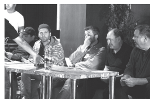
Porota to vôbec nemala ľahké.

neskôr odporučila radšej sa sústrediť len na niekoľko point. No zároveň ocenila jeho frázovanie a veľmi rýchlu vokálnu kadenciu. Aj keď samotný