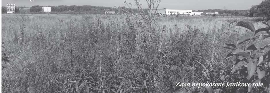
Zasa nepokosené Janíkové role.

Nik vám nedokáže toľko dať, koľko vám ja môžem sľúbiť, je známy nevy-povedaný volebný slogan. Zrazu každý vie, kde čo nejde a čo treba, aby išlo, kde na čo celé štyri roky nebolo, práve teraz sa nájde a stále bude. Vyťahujú sa hriechy predchodcov z minulého i predminulého obdobia ako odpoveď na opodstatnenú kritiku súčasníka, a keď ani to nezaberie, na vine je bývalý režim, hoci od jeho pádu na Slovensku vyrástla už jedna nová generácia.