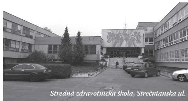
Stredná zdravotnícka škola, Strečnianska ul.