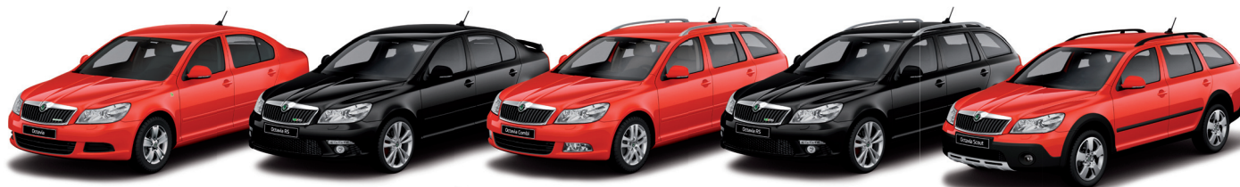
Ilustračné foto. Kombinovaná spotreba a emisie CO2 automobilov Octavia: 4,5 - 7,2 l/100 km, 119 - 168 g/km. Ponuka platí do vypredania zásob.

Predvážacie vozidlá ŠKODA Octavia teraz v tých najlepších cenách u nás.