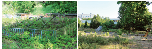
Takto dnes vyzerá areál škôlky.