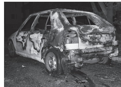
Toto bola Škoda Felicia na Tematínskej ulici krátko predtým, ako zažiarila do neskorého večera.