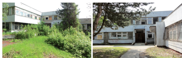
Schátraná budova materskej školy na Vyšehradskej ulici.