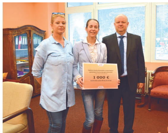
Podpora Občianskeho združenia Brána do života.

Vďaka aktívnej a dlhodobej spolupráci mestskej časti a spoločnosti Veolia Energia Slovensko v júni 2016 Petržalka získala prestížne ocenenie Cogen Europe Recognition Award za projekt kombinovanej výroby elektrickej energie a tepla prostredníctvom 18 kogeneračných jednotiek inštalovaných v systéme centrálného zásobovania teplom (CZT). Získané ocenenie potvrdilo, že výroba a dodávka tepla a teplej úžitkovej vody v Petržalke sa realizujú moderným, ekonomickým a ekologickým spôsobom.