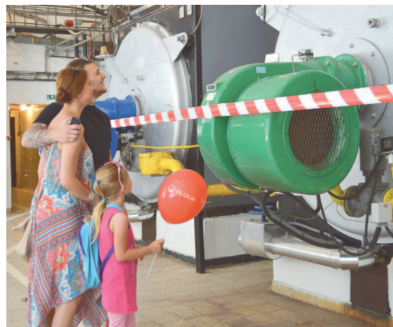
Deň otvorených dverí v kotolni skupiny Veolia Energia v rámci Dni Petržalky 2016.

Ďalší finančný dar, na ktorý prispeli aj zamestnanci spoločnosti Veolia Energia Slovensko, bol venovaný Občianskemu združeniu Brána do života na podporu vzdelávania detí zo slabších sociálnych pomerov. Pri prí-