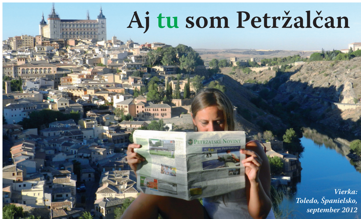
Vierka: Toledo, Španielsko, september 2012