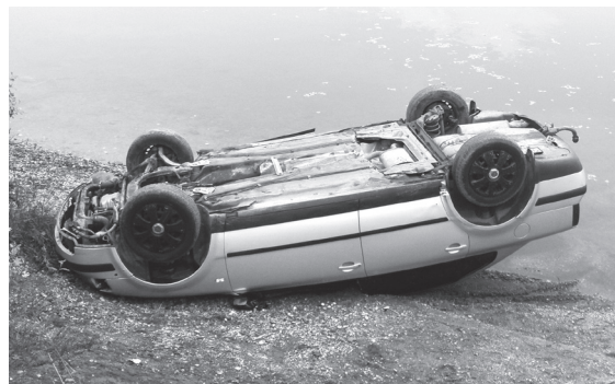
Aj takto sa môže skončiť nedostatočná pozornosť pri riadení vozidla.

trnosti, najmä v okolí škôl, obchodných centier, kostolov, kultúrnych a reštauračných zariadení nikdy nie je dosť. Vyvarujte sa chýb, ktoré môžu mať ďalekosiahle následky.