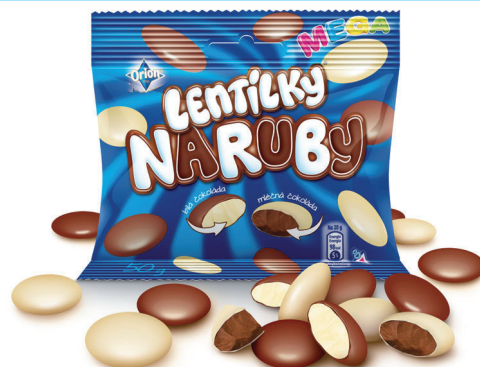
MEGA LENTILKY NARUBY (50 g) odporúčaná maloobchodná cena 0,85 EUR.

TIP: Ďalšie zaujímavé informácie nájdete tiež na www.lentilky.cz .