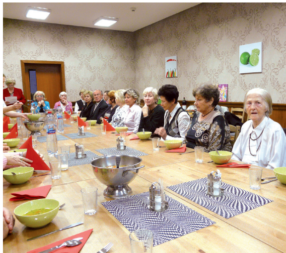
Takto sa rozlúčkové stretnutie začínalo...

Text a foto: (ak) ... a takto sa končilo.