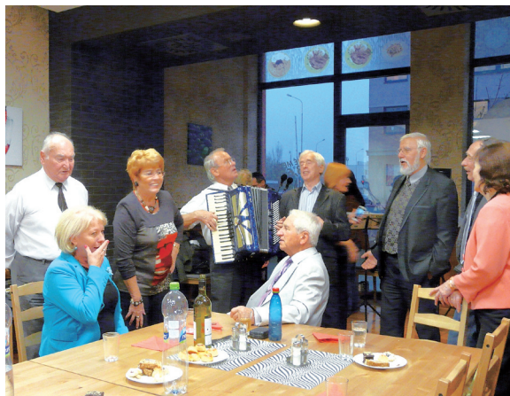
... a takto sa končilo.