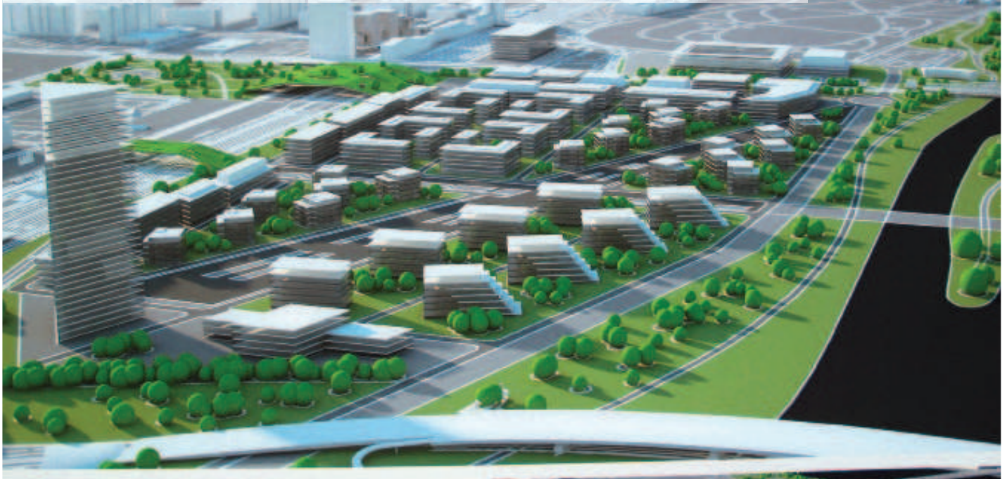
Aj takto by mohla vyzerat' Petržalka. Jedna z predstáv študentov architektúry.

Petržalka v týchto dňoch ukončila pripomienkovanie Programu hospodárskeho a sociálneho rozvoja na roky 2016 až 2023 s výhľadom do roku 2040. Ide o základný dokument mestskej časti, ktorá na 140 stranách popisuje chod Petržalky a určuje základné priority, na ktoré sa má zamerať v najbližších rokoch. Jeho tvorba trvala deväť mesiacov.