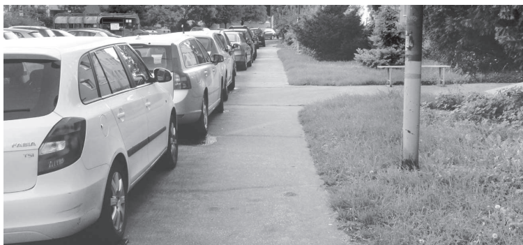
Parkovanie? Žiadny problém.

... v čase od 11. 2. 2016 do 19. 2. 2016 nahlásili v našom kraji krádež 20 motorových vozidiel, z toho v Petržalke šesť (Čerňavského, Jasovská, Víglašská, Ševčenkova, Vavilovova, Betliarska)? V noci zloději potiahli 15 a cez deň 5 áut. Dňa 15. 2. nehlásili žiadnu krádež auta.