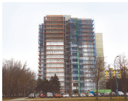
Na Beňadickéj ulici