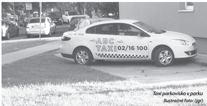
Taxi parkovisko v parku

... v čase od 21. 2. do 7. 3. nahlásili v našom kraji krádež 20 motorových vozidiel, z toho v Petržalke osem (Jungmanova, Haanova, Jantarová cesta, Gettingova, Topolčianska, Beňadická, Ševčenkova, OC Aupark)? V noci zloději potiaholi 17 a cez deň tri autá. V dňoch 24. - 26. februára, 2. a 5. marca krádež auta nehlásili.