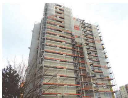
Na Hálovej ulici