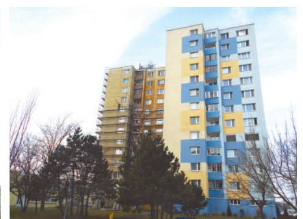
Na Smolenickej ulici