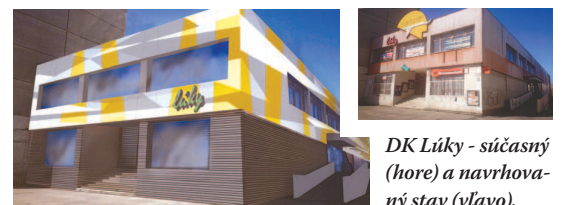
DK Lúky - súčasný (hore) a navrhovaný stav (vľavo).