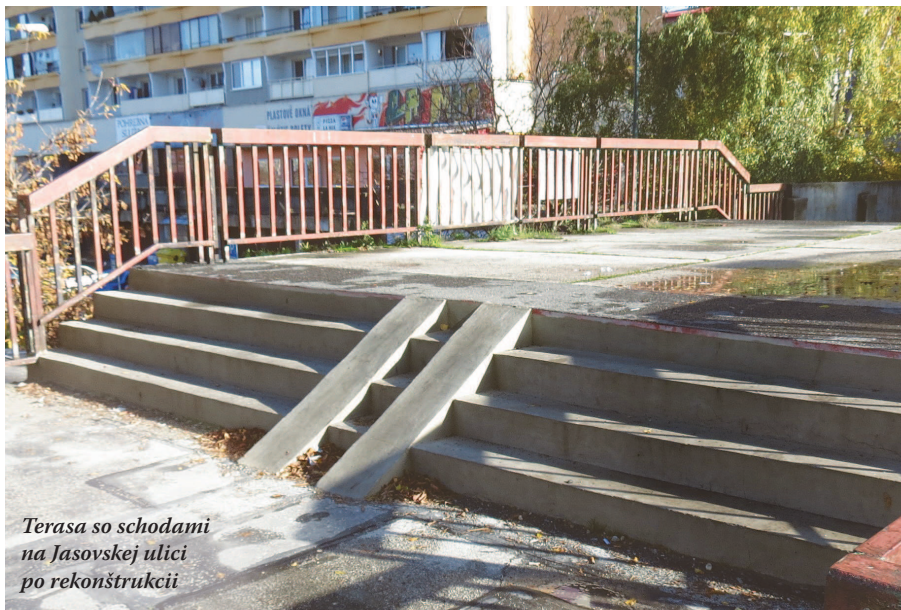
Terasa so schodami na Jasovskej ulici po rekonštrukcii