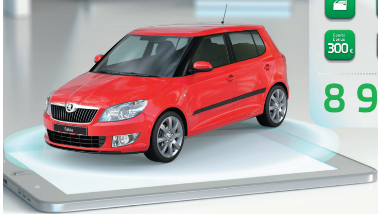
Kombinovaná spotreba a emisie CO2 automobilu Fabia: 4,2 - 5,9 l/100 km, 109 - 139 g/km. Ilustračné foto.