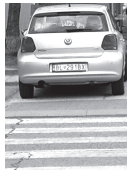
Bez záujmu polície platí právo silnejšie

možné zapísať do cestovného pasu rodiča. Vydanie pre občana staršieho ako 16 rokov stojí 33 eur, od 6 do 16 rokov 13 eur a pre dieťa mladšie ako 6 rokov 8 eur. Za vydanie cestovného pasu do dvoch pracovných dní zaplatíme trojnásobok a do 10 pracovných dní dvojnásobok príslušnej sadzby. Informáciu o vyhotovení nového dokladu je možné žiadateľovi zaslať prostredníctvom služby SMS notifikácia alebo e-mail notifikácia v rámci celého Slovenska. Služba nie je spoplatnená