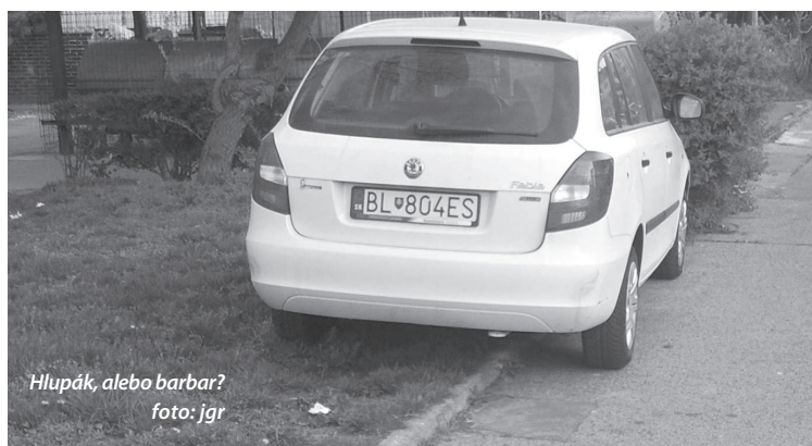
Hlupák, alebo barbar?

V bratislavskom kraji za prvé dva mesiace roka 2016 zaznamenali policajné štatistiky šesť prípadov trestného činu Prijímanie úplatku (SR 24), na základe ktorých boli vyšetrované tri osoby (objasnenosť 50 %). Tak vraví § 328 trestného zákona v súvislosti s prijímaním úplatku: Kto priamo alebo cez sprostredkovateľa pre seba alebo pre inú osobu prijíma, žiada alebo si dá sľúbiť úplatok, aby konal alebo sa zdržal konania tak, že poruší svoje povinnosti vyplývajúce zo zamestnania, povolania, postavenia alebo funkcie, potrestá sa odňatím slobody na dva roky až päť rokov. (Okolnosťou podmieňujúcou použitie vyššej trestnej sadzby - tri roky až dvanásť rokov - je závažnejší spôsob konania, čin veľkého rozsahu).