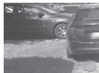
Parkujem na trávě a je mi dobre.

s deliktami polícia vyšetrovala či stihala 1 059 ľudí (SR 7 843), z ktorých boli tri maloleté (SR 163) a 24 mladistvých osôb (SR 450). Z celkového počtu zaevidovanej kriminality najvyšší počet trestných činov, až 3 616 prípadov (SR 4 867) zaznamenala majetková kriminalita, pri ktorej objasnenosť dosiahla 31% (SR 47%). Pod vplyvom alkoholu boli páchatelia v 166 (SR 1 261) a drogy im dopomohli k trestnej činnosti v šiestich prípadoch (SR 18).