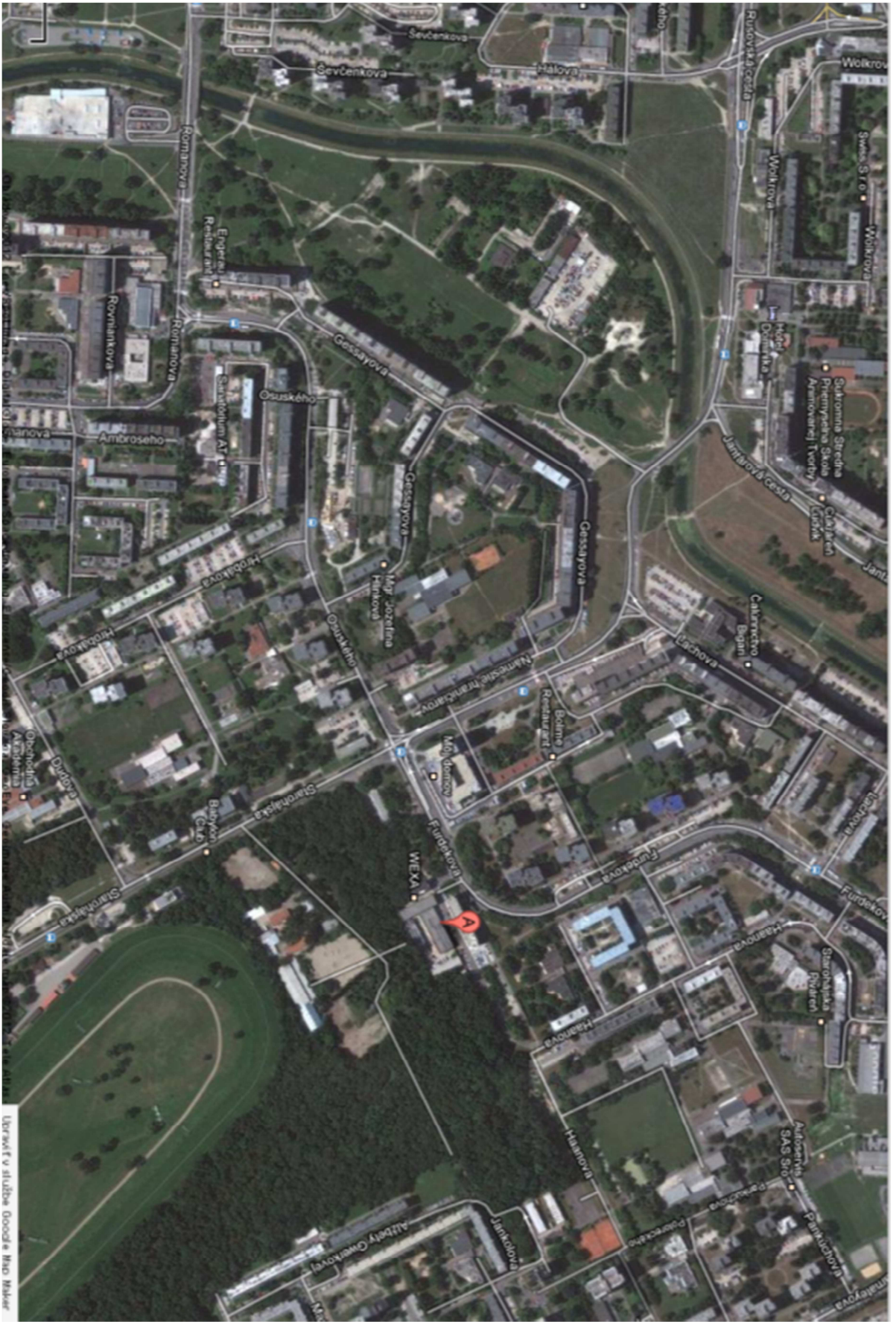
Ubravt' v službe Google Map Maker