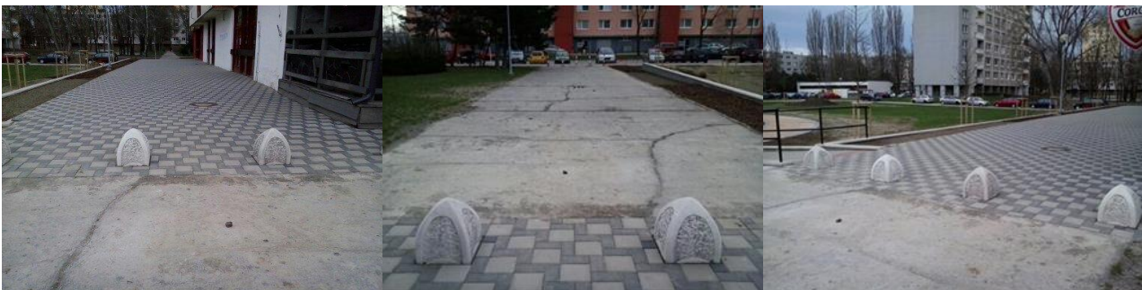
Na parcele č. 766 je časť chodníka v dezolátnom stave (popraskaný asfalt)