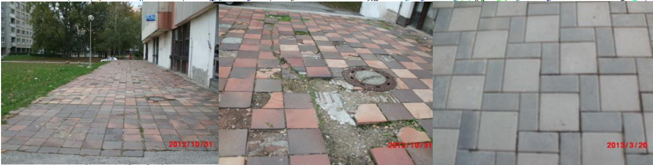
Cca 1/2 chodníka na parcele č. 766 je rekonštruovaná (foto pred rekonštrukciou a po nej)