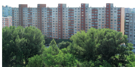
Pohľad z Jungmannovej pripomína už v novom šate Petržalku pred tridsiatimi rokmi.