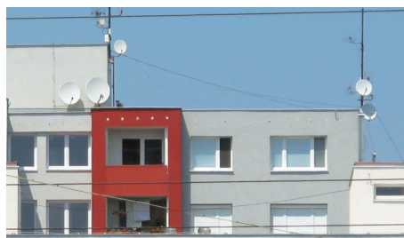
Satelity nepatria na fasády, ale na strechy - dôkaz na paneláku Holičska 20