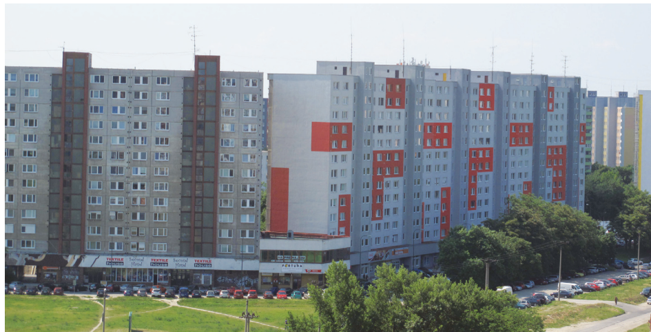
Vynovený dom na Gessayovej 10-20 s tromi správcami sa štruktúrou farebnosti priznáva, že je panelák. Aký bude sused?