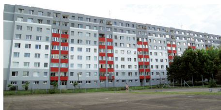
O paneláku na Budatínskej 53-59 sa hovorí, že patrí medzi najkrajšie.