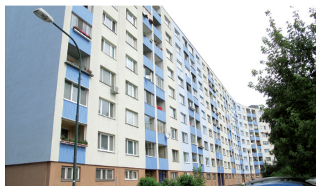
Liniová stavba v modrobielej línii na Ševčenkovej 25-33