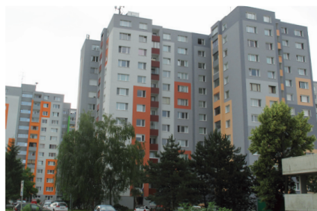
Pošta na Furdekovej ústi do rovnako farebného domu na Mlynarovičovej 13-15