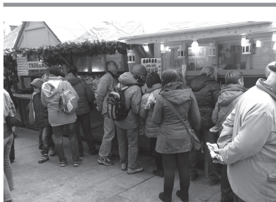
Obľúbeným pracoviskom vreckových zlodějov sú vianočné trhy.