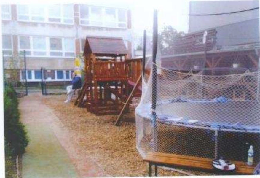
Detská záhrada s preliezkou, trampolínou