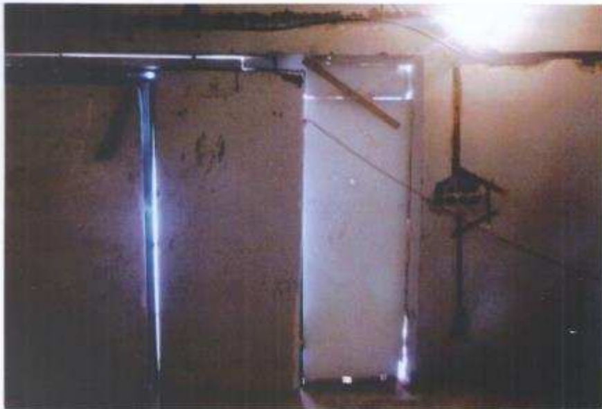
Pred úpravou – klubovňa