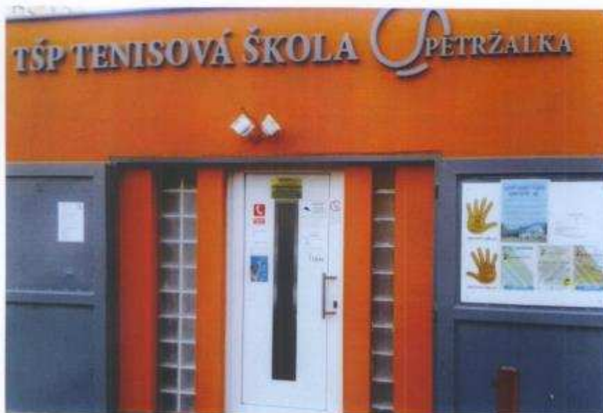
Po úprave – klubovňa, pohľad z vonka