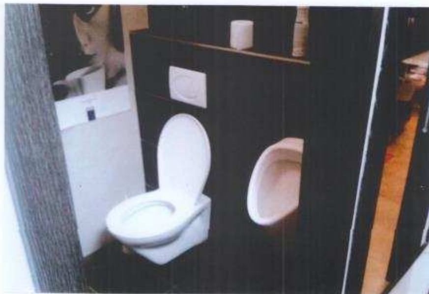
Po úprave – klubovňa, pánska toaleta