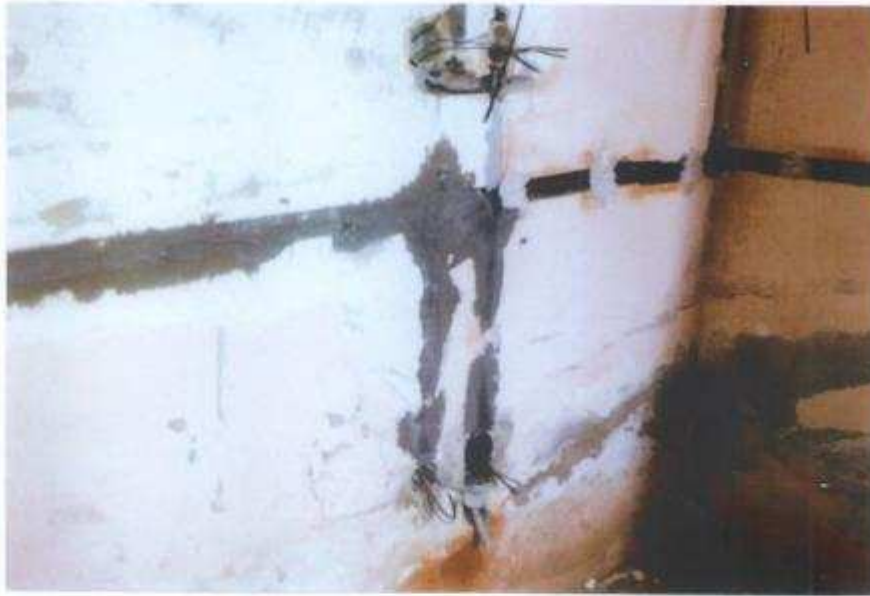
Pred úpravou – klubovňa, pánska šatňa