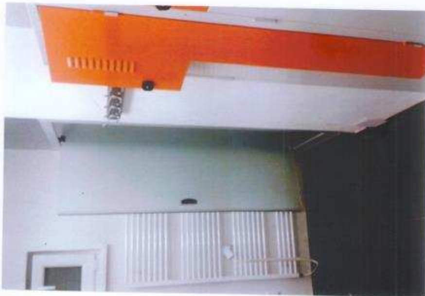
Po úprave – klubovňa, pánska šatňa