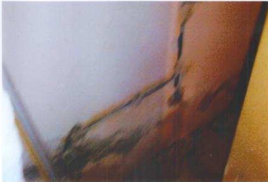
Pred úpravou – klubovňa, pánska toaleta