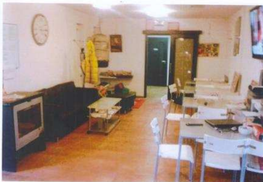
Po úprave – klubovňa