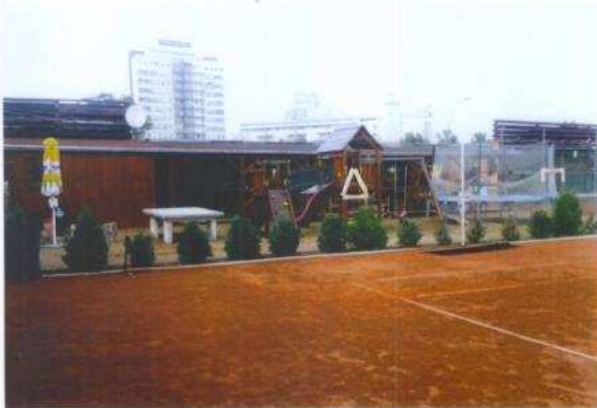
Detská záhrada s preliezkou, trampolínou