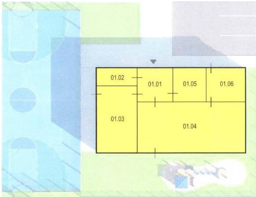
SCHÉMA 1.NP PôDORYSU