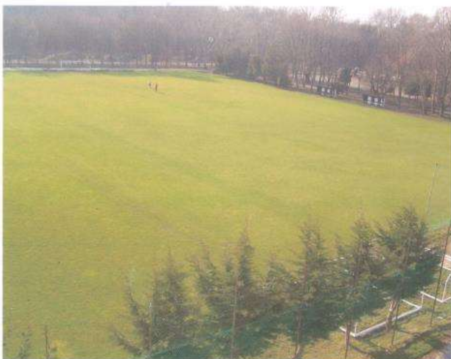
EXISTUJUCÍ FENOMÉN PLOCHY