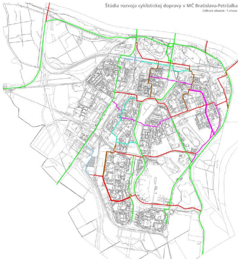
Obr. 1 – 1.etapa návrh cyklistických trás