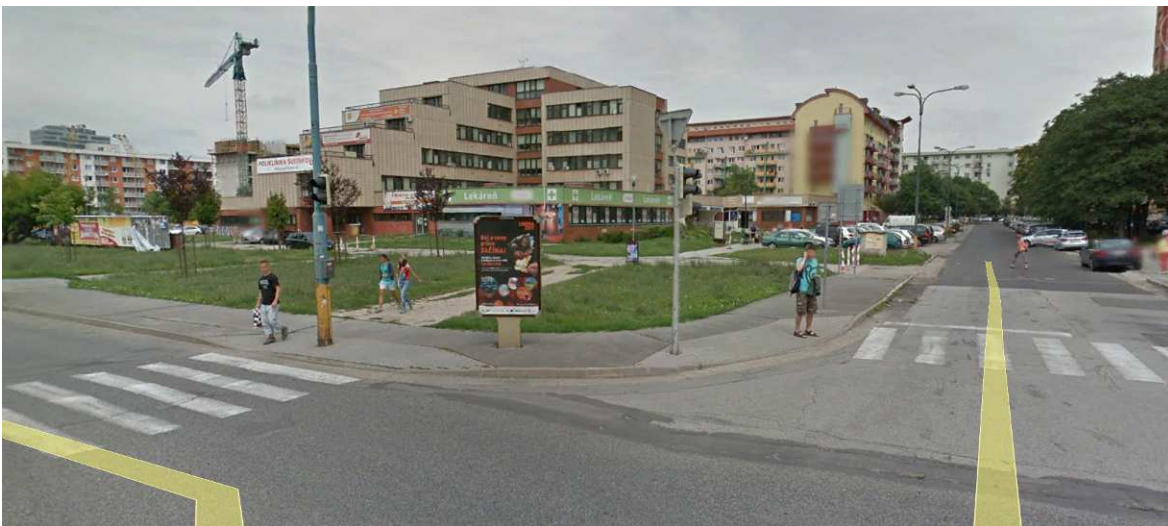
Vyšľapaný chodník k zdravotnému stredisku, citilight v prostriedku chodníka výrazná bariéra