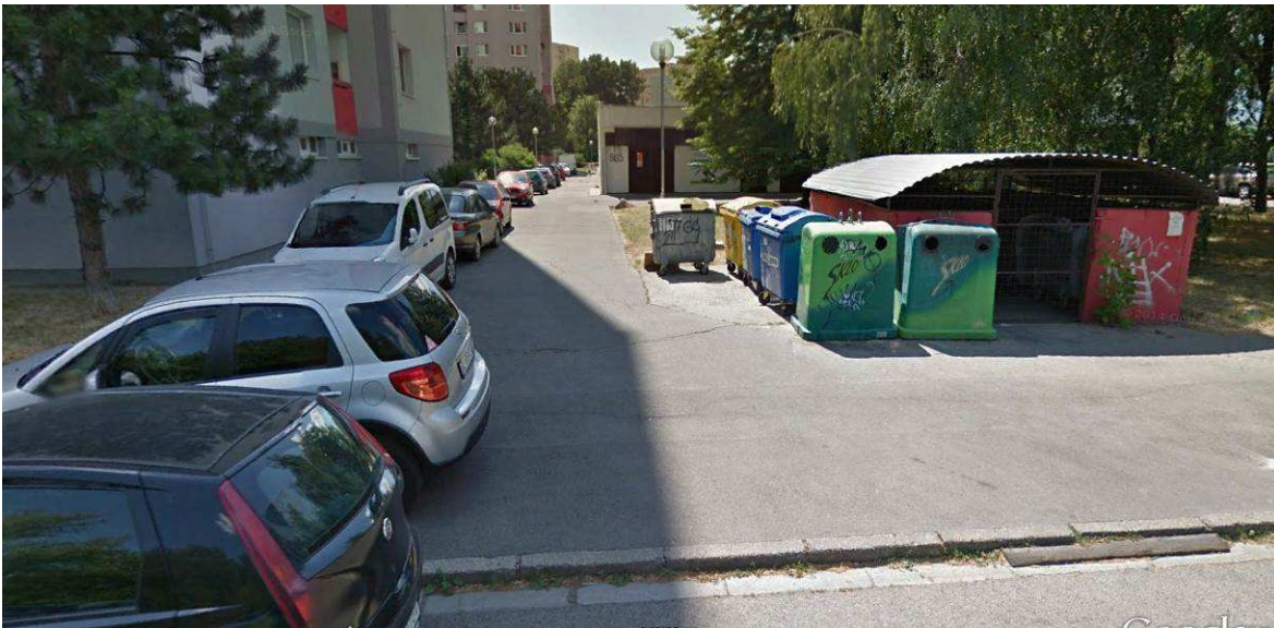
Vnútroblok? (jedna z hlavných trás ráno do škôlky a dvoch škôl)