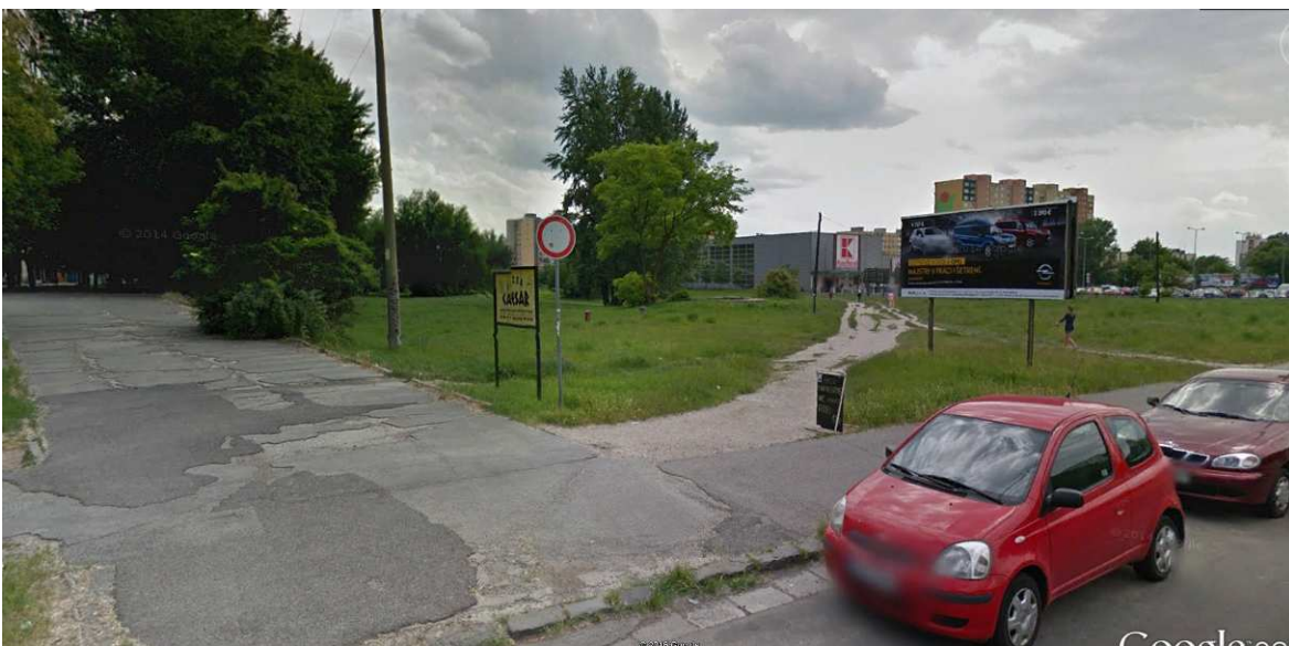
Technický stav a jeden z prístupov do nákupného centra