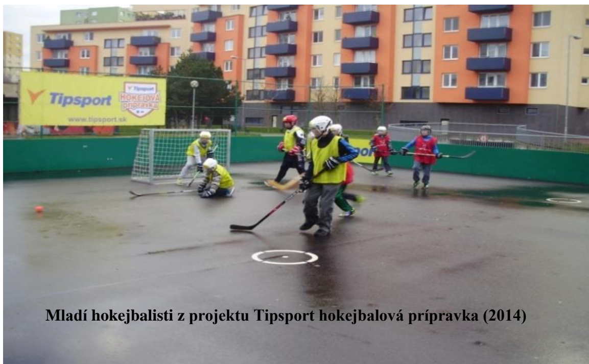
Mladí hokejbalisti z projektu Tipsport hokejbalová prípravka (2014)