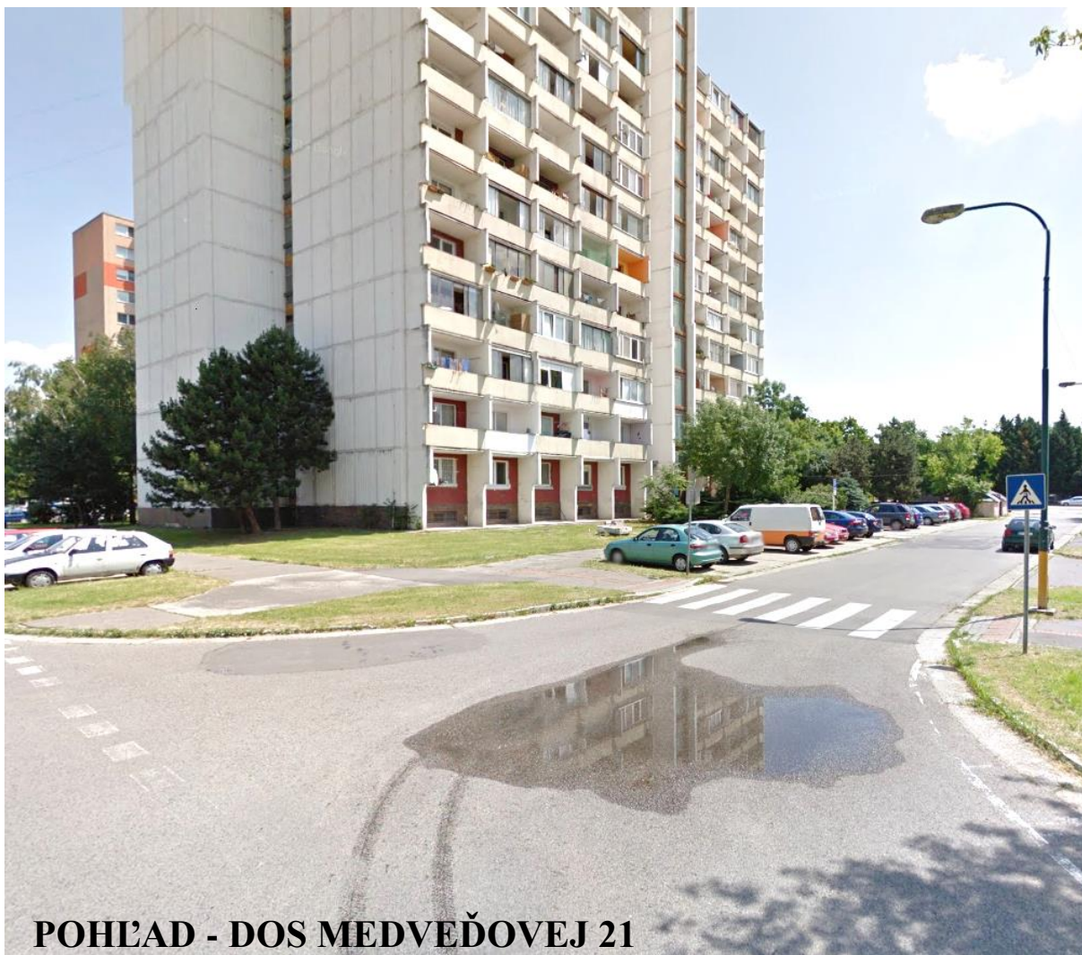
POHLAD - DOS MEDVEĐOVEJ 21