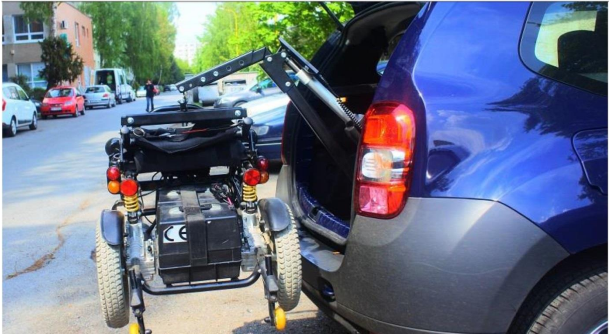
Obr. 2 – Žeriav na nakladanie invalidného vozíka (ilustračná fotografia)