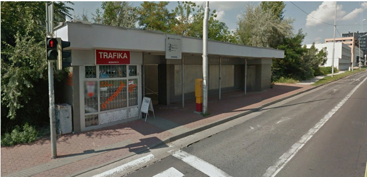
Nástup na Železničnú stanicu Petržalka