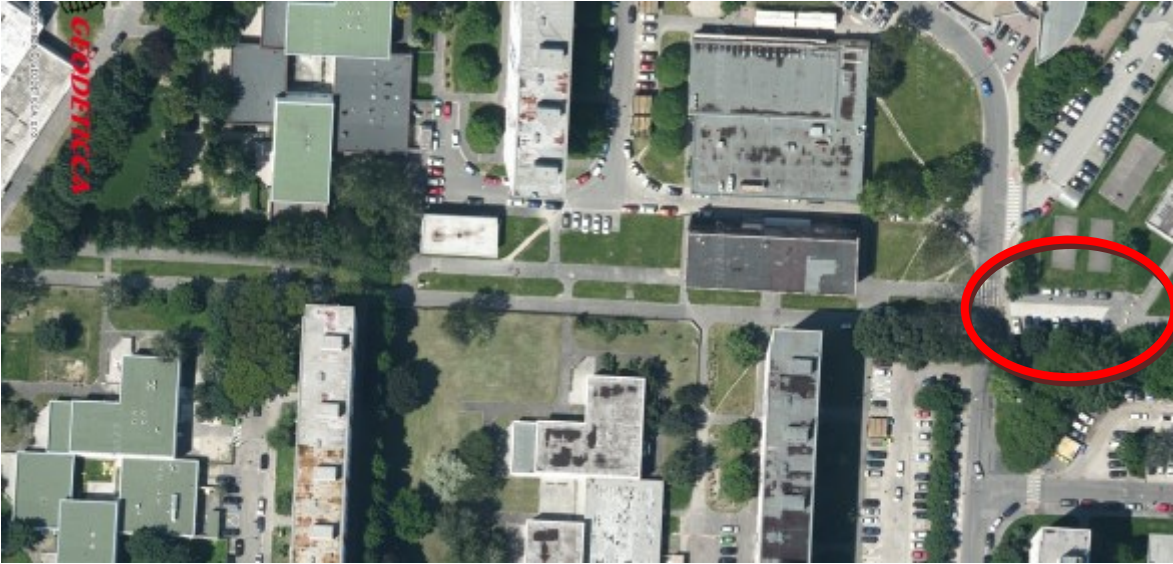
Ukončenie pešej promenády do „parkoviska“