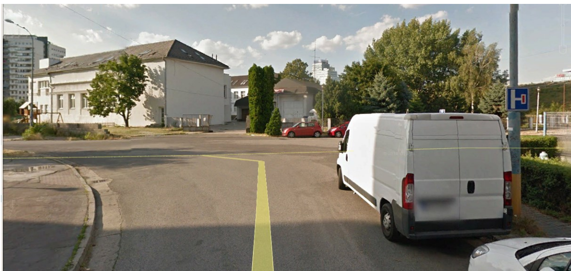
Chýbajúce bezpečné prepojenie Dvory V – Digital park