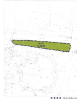
Obrázok 2 Súčasný stav územia v súlade s platným územným plánom hl.m. SR Bratislavy v znení neskorších zmien a doplnkov

Návrh na overenie funkčného využitia jednotlivých častí územia dokumentujú nasledujúce schémy a tabuľky.