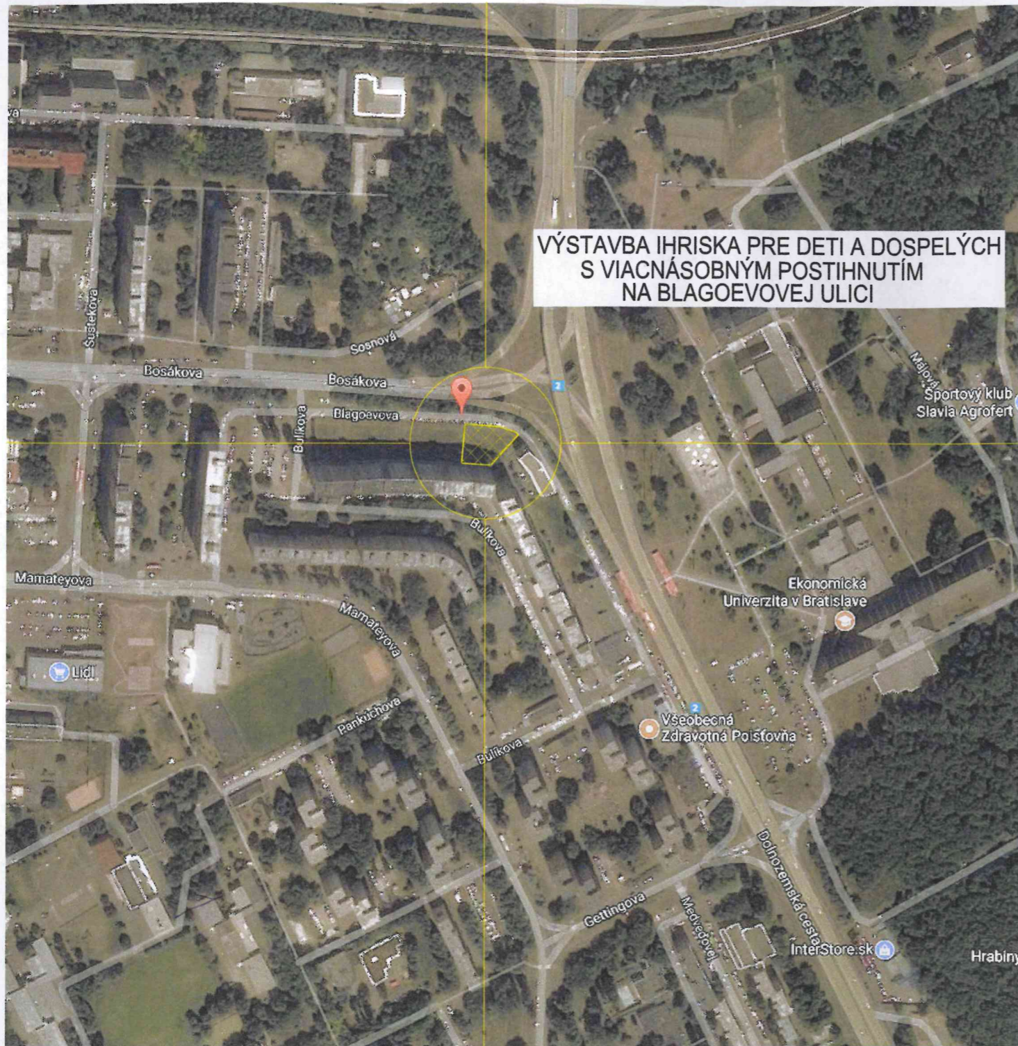
SITUÁCIA NA PODKLADE ORTOFOTOMAPY