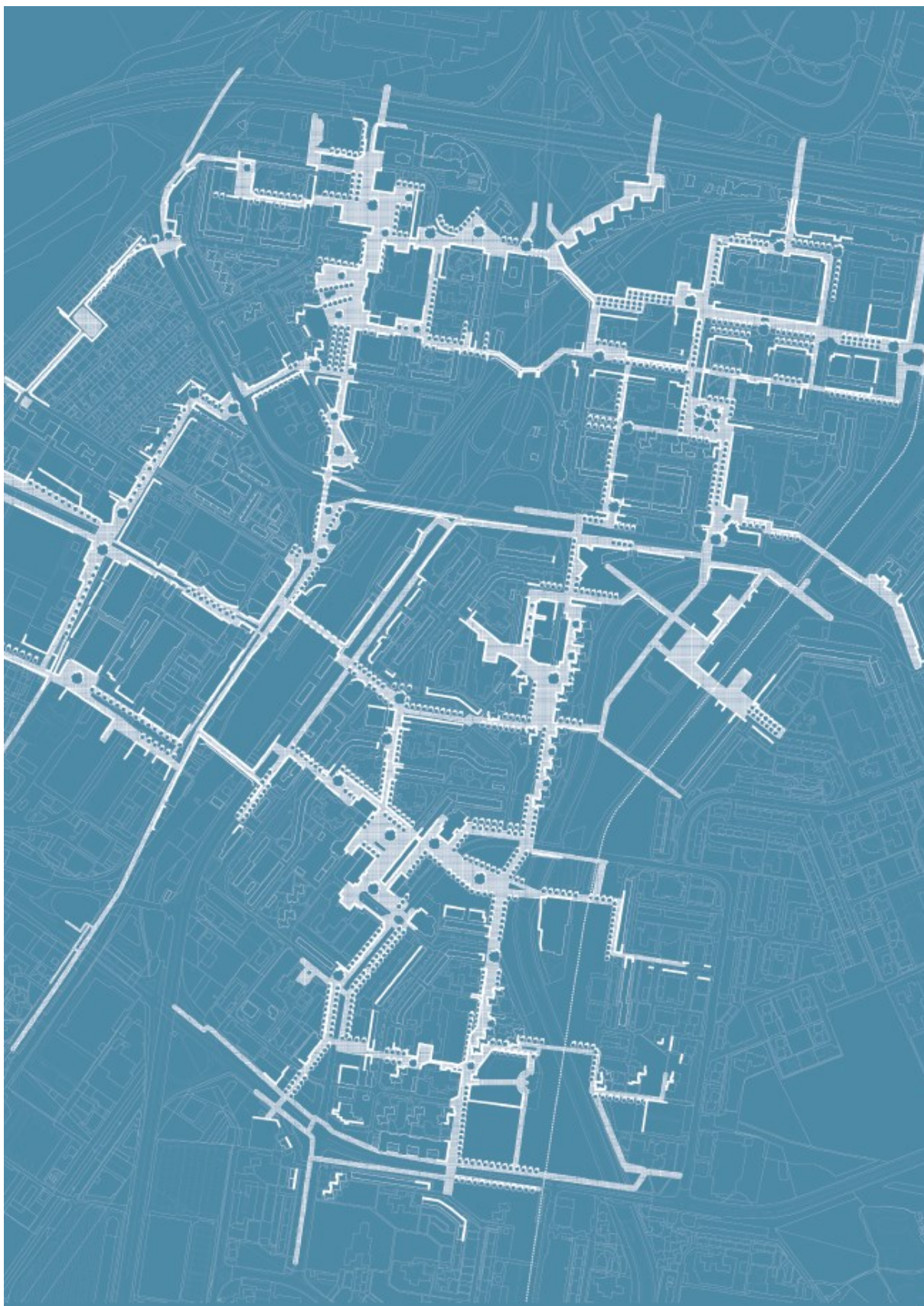
Celkový pohľad na sieť peších trás (Dvory)