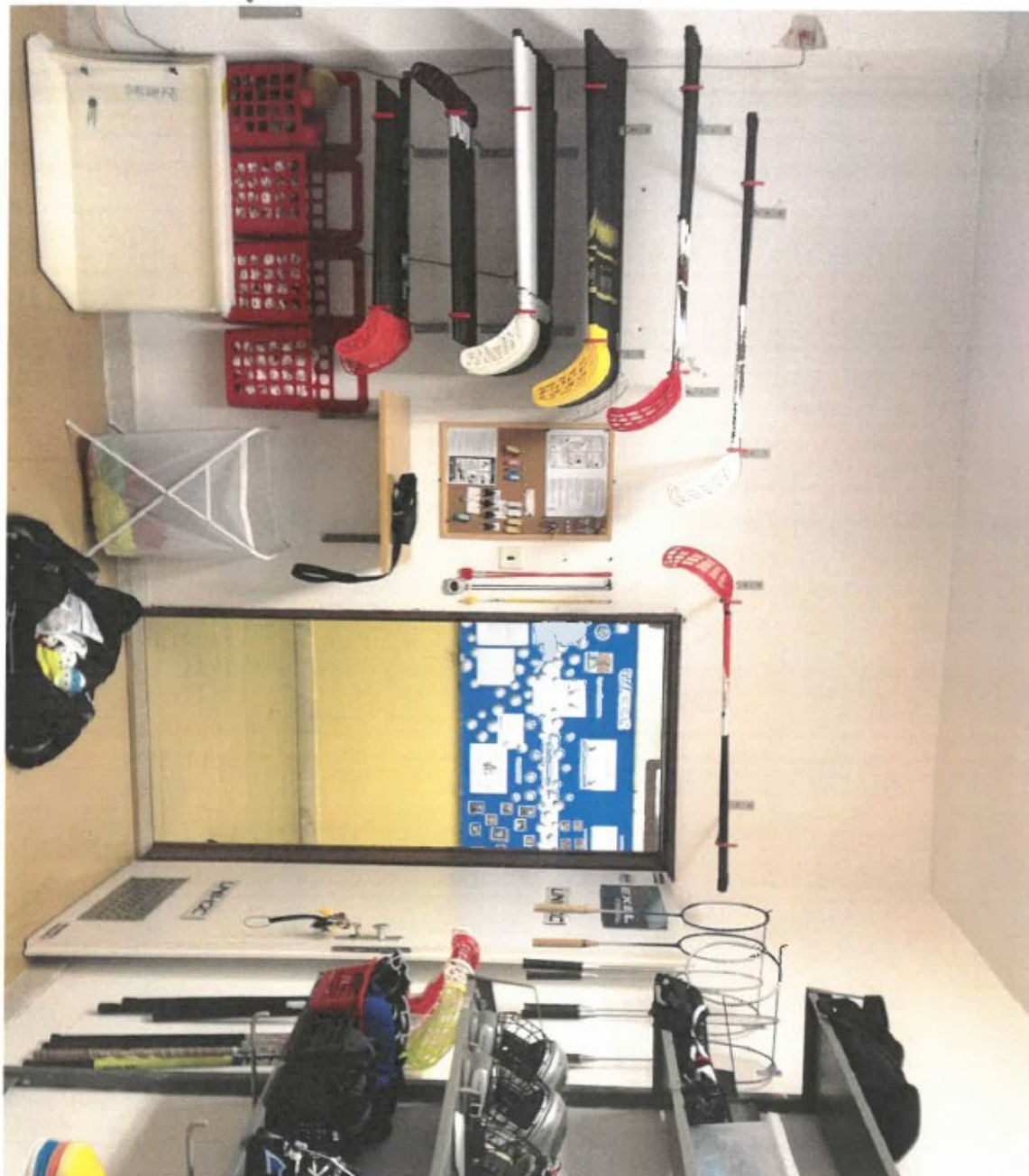
Priloga č. 3